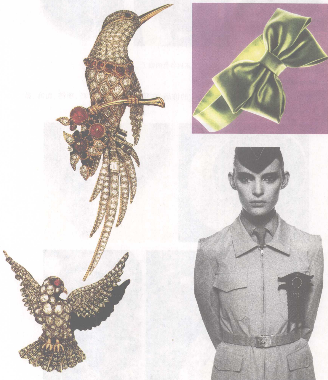
图1-4 不同特色的领饰