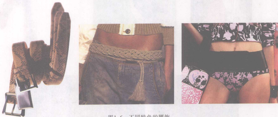
图1-6 不同特色的腰饰