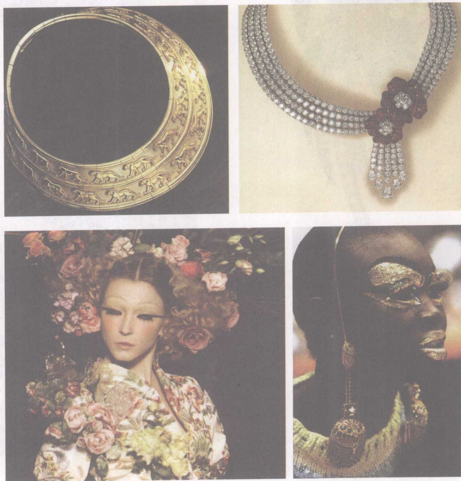
图1-3 不同特色的首饰

首饰,是指用于头、颈、胸、手等部位的饰品,它通常包括发饰、耳环、项链、面饰、鼻饰、腕饰、臂饰等(图1-3)。