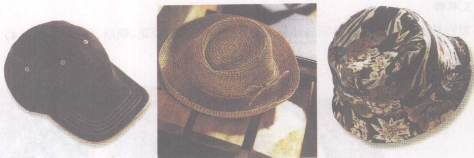
图1-2 不同特色的帽子