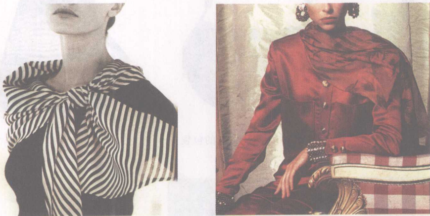
图1-5 不同特色的围巾和披肩

围巾、披肩,是以实用为基础,用于颈部、肩部的以纺织物为主要材料的饰物(图1-5)。