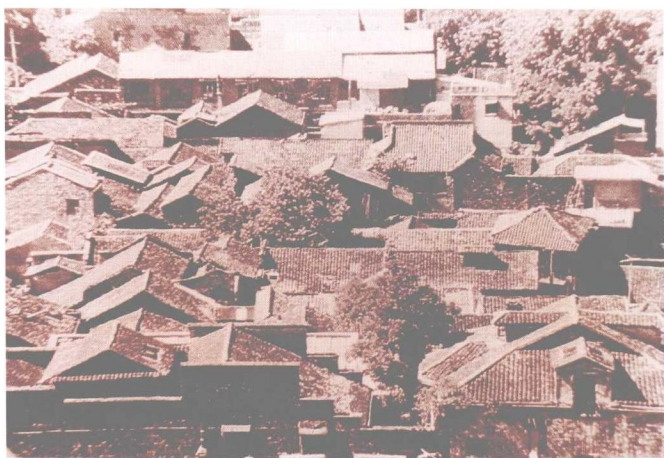
◆ 长沙老城中的传统街区，摄于 20 世纪 80 年代。