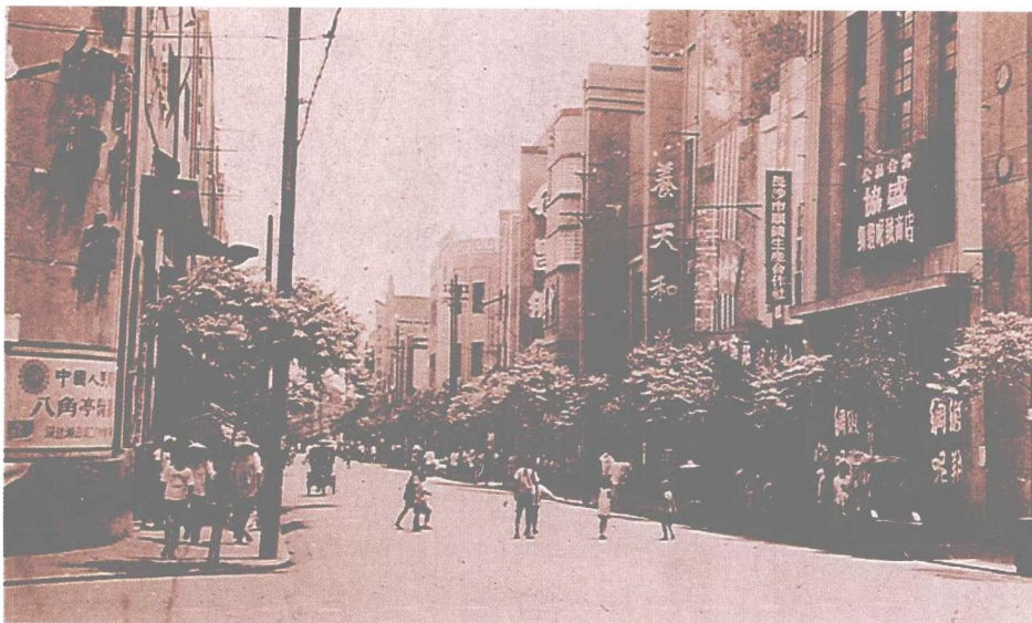
◆ 1936年时的八角亭，介昌绸布庄、养天和药局、协盛绸缎呢绒店等老字号历历在目。

初长沙全景照片中，可见当时的长沙城，山川萦绕，平展而浩大，粉墙青瓦的民居错杂交接，城内街衢纵横，间井相望，古树回环，宫室巍峨。从保留至今的民国初期建筑，如谘议局大楼、湘雅医院门诊楼、基督教永恒堂以及粉墙青瓦民居、石库门公馆等，可窥视当时长沙建筑的独特风格。它们介于江南传统古典建筑与西方现代建筑之间，既延袭古风古韵，又展现时代特色，体现了湖湘文化传承与兼容的有机融合。在长沙建设现代化城市的进程中，如何留住历史文化名城特色和个性，如何保护和改造有价值的历史街区，已成为人们关注的一个问题。