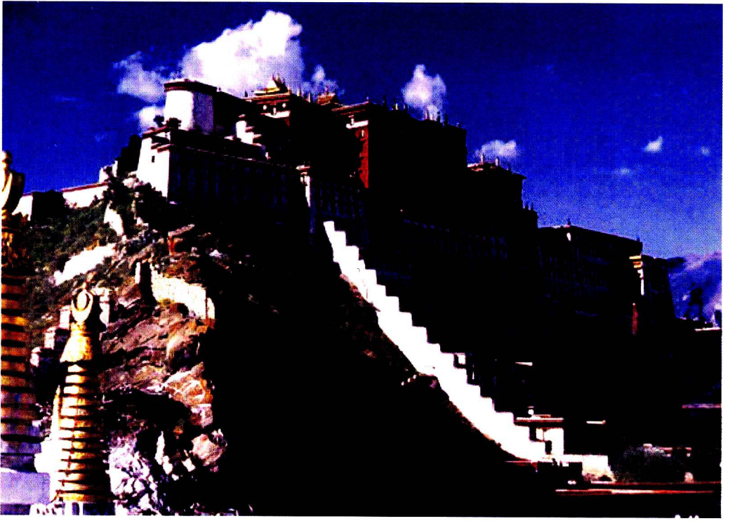
彩图1 拉萨布达拉宫