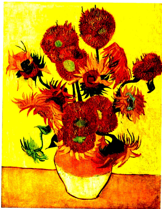
彩图5 [荷兰] 凡·高 《十四朵向日葵》