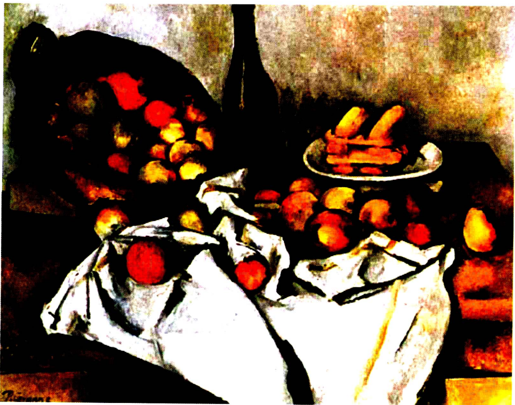
彩图6 [法] 塞尚 《静物》