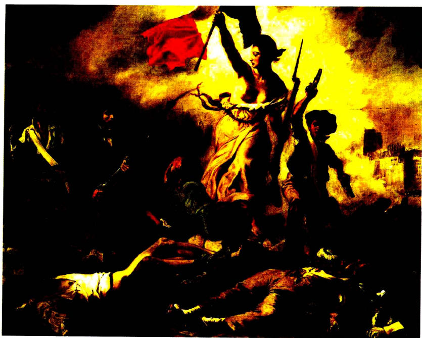
彩图4 [法] 德拉克洛瓦 《自由领导人民》