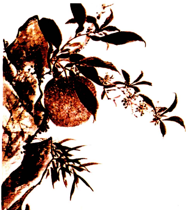
彩图7 [明代] 徐渭 《榴实图》(局部)