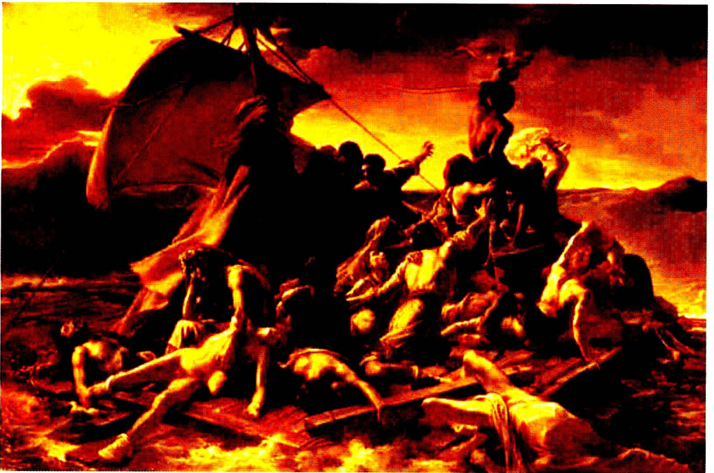
彩图2 [法] 藉里柯《梅杜萨之筏》