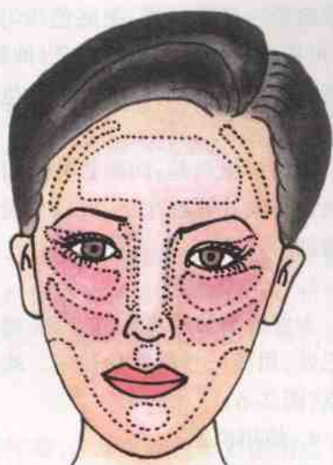
图 2-4 立体化处理