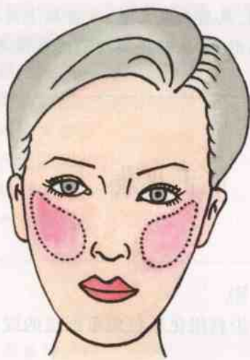
图 2-2 民族涂法

(2) 欧式涂法。在太阳穴下两指处的颧骨外侧,沿脸部斜下方蘸腮红轻扫呈斜条状。此种涂腮红的方法使面容显得秀气、清纯(图 2-3)。