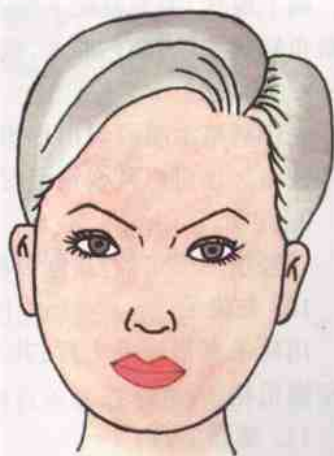
图 2-5 圆形脸型