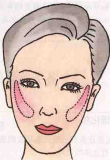
图 2-3 欧式涂法

(3) 一般涂法。沿颧骨下侧蘸腮红横向轻扫,向四周晕开。此种涂法面容给人以丰满、圆润感。