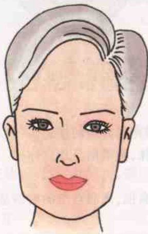
图 2-9 长方形脸型

化妆第一步要清洁脸部,第二步是轻拍一层营养水,第三步轻涂一层营养霜。接下来是打底色。粉底颜色选择接近本人肤色再浅一号的底色。为矫正方形脸型,可以在前额、下颏处施以掩盖色,以缩短脸的长度,但阴影与粉底的衔接要自然。