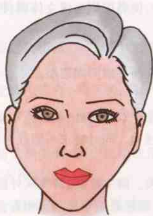
图 2-11 菱形脸型

选择橄榄绿色或赤褐色阴影膏在两颧骨外侧轻抹一些,可以削弱颧骨高的弊端(图 2-12)。