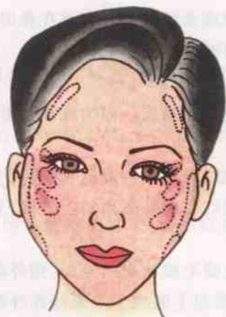
图 2-12 立体化处理