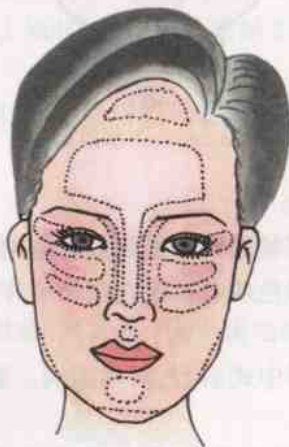
图 2-10 立体化处理