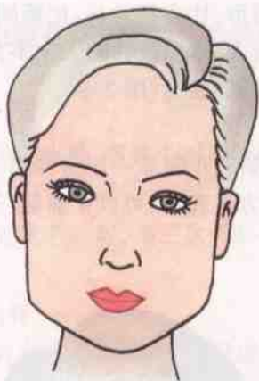
图 2-7 方形脸型

用浅色粉饼在脑门、鼻梁、人中和下巴处拍一层定妆粉。此种打法使脸部呈“T”字形突出点,生成柔美的立体感(图 2-8)。