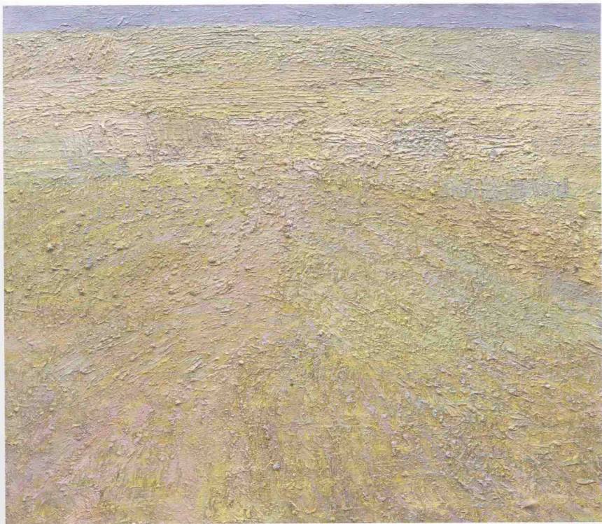
布面油画《北方原野》之二 65cm×75cm