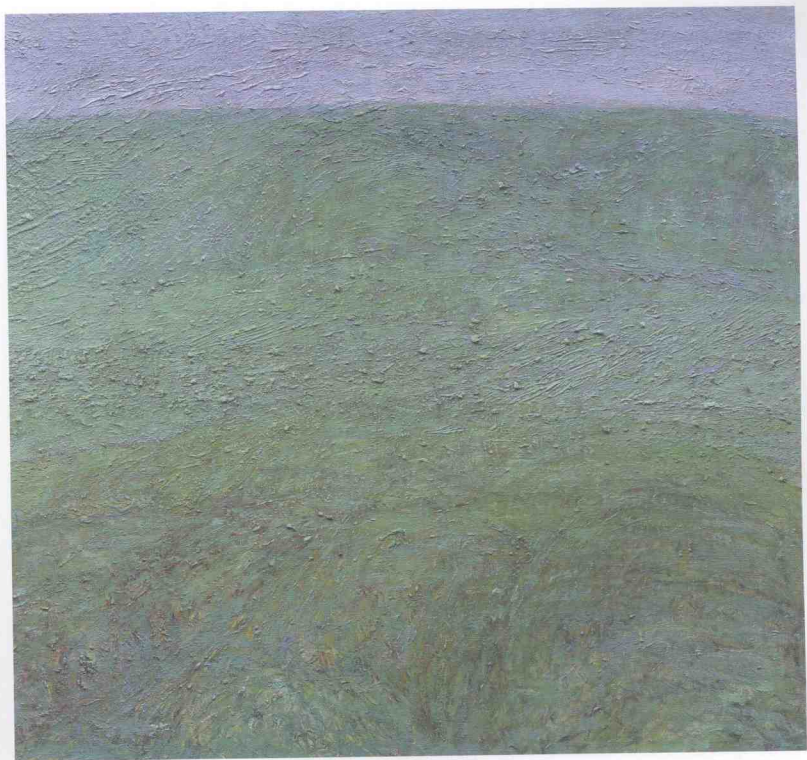
布面油画《北方原野》之一 65cm × 75cm