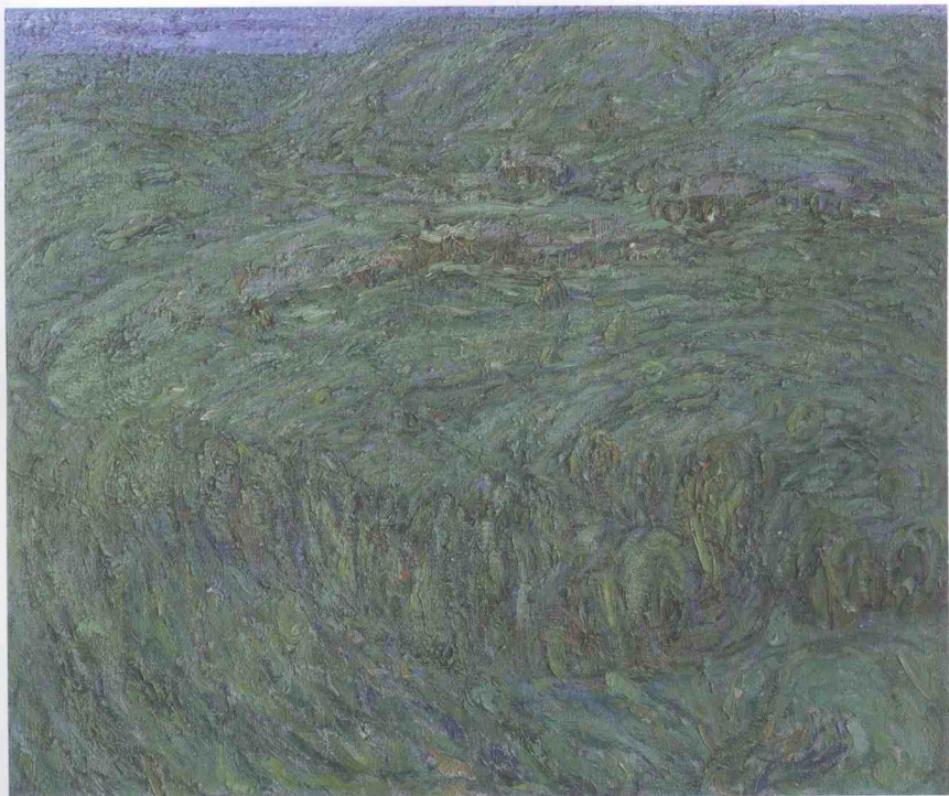
布面油画《北方原野》之四 90cm×100cm