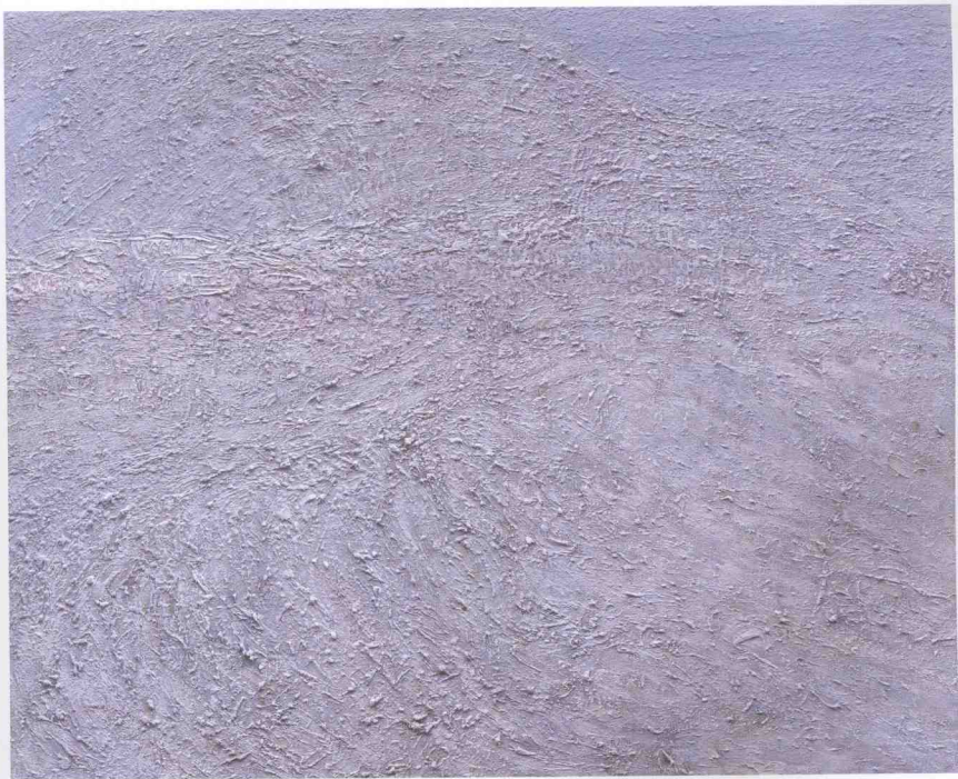
布面油画《北方原野》之三 65cm × 75cm