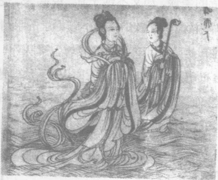
《九歌图》 [元]张渥 楚辞《九歌》中的《湘夫人》即女英

虞舜的瞎老爸和弟弟象听说虞舜得到这么多东西，就起了坏心。瞎老爸叫虞舜到粮仓顶上去抹顶篷，他在粮仓下面放火，想要烧死虞舜。幸亏这个阴谋早被娥皇和女英识破了，她们叫虞舜带两顶斗笠上仓顶去工作。虞舜看到下面火起，赶快一只手举一顶斗笠，好像张开一对翅膀一样跳了下来，脱离了危险。瞎老爸和象一计不成，又施一计。过了几天，瞎老爸叫虞舜去挖井，估计着井挖得很深了，就把泥土石块倒进井里，想活埋虞舜。他们没想到虞舜在底下开了一条斜巷，蹲在里面休息。井填死了。他从斜巷里挖开一个出口，爬出来。二流子象以为虞舜准死在井底下了，就对老爸老妈说：“主意是我出的，两个嫂嫂和舜的琴都要分给我，他的牛羊谷仓就给二老吧。”象说完立刻跑到舜的家里，拿起舜的琴来弹。弹到一半，舜突然出现在屋门口，象惊愕万分，只好解释说：“我正在怀念哥哥，所以弹琴以寄托思念之情。”舜没有揭他的老底，反而笑着说：“这样就好，这样才是弟弟该有的样子。”从此舜对父亲和弟弟更为爱护。