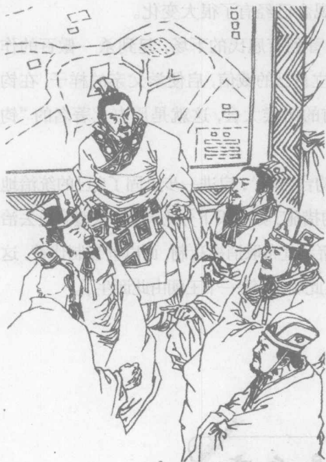
启进一步笼络各方诸侯

禹一方面让伯益辅助自己治理国家，一方面却把大部分精力都放在对启的培养上。他让启学习治国的方略，广泛地与各路诸侯接触，又逐年将国家中所有管事的官员都换成了启的亲信和好友。经过几年的精心布置，启的势力渐渐超过了伯益。对这一切，伯益却毫无察觉。