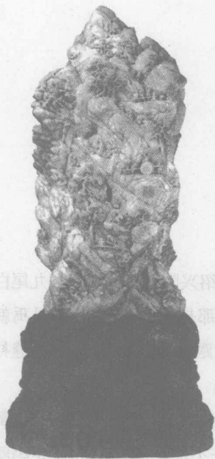
大禹治水玉山子〔清〕