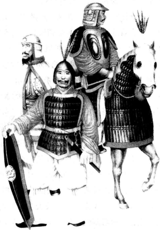
南北朝武士复原图

月，乘胜沿长江而上，袭取丹徒，拥众十余万，楼船千余艘，军容极盛。时晋廷兵力空虚，内外戒严，急调兵遣将防卫京师。刘牢之自山阴引兵攻打义军，但未至而义军已过山阴，便令刘裕自海盐驰援京师。时刘裕部不满千人，倍道兼行，与义军一起进抵丹徒。刘裕部兵少且疲，而丹徒守军也没有斗志。孙恩指挥数万义军抢占镇江之蒜山，刘裕率领所部奔击，大破之，投崖赴水死者甚众。孙恩失利，退至船上，欲恃其兵众，整兵直攻建康(今江苏南京)。晋后将军司马元显率军拒战，屡被打败。义军因战船高大，逆行慢，数日才进至白石垒(今南京市西)，贻误了战机，所以刘牢之等得以率军尾追而来。孙恩遂放弃攻建康，分兵袭