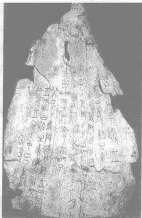
图2 商代甲骨文《祭司狩猎涂朱牛骨刻辞》

刻或写在龟甲及牛骨上的文字。这些文字已有三千多年的历史。另外，在地下出土了很多商周时代的铜器，上面铸有很多铭文，称为钟鼎文（简称金文）。这两种文字，因为是现在所能见到的最早的文字，所以又称为古文。甲骨文是中国文字史上的第一块瑰宝，于1889年在河南省安阳小屯村一带发现，是殷商晚期王室占卜时用刀刻写在龟甲和兽骨上的卜辞，距今已三千多年。其笔法已有粗细、轻重、疾徐的变化，下笔轻而疾，行笔粗而重，收笔快而捷，具有一定的节奏感（见图2）。