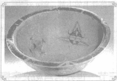
图 1 陶盆

土的陶文以半坡陶文为最早，大约自公元前 4800 ~ 4300 年之间。半坡遗址于 1921 年在中国黄河中游的河南仰韶村被发现，被命名为“仰韶文化”。在半坡遗址出土了一些类似文字的简单刻画的彩陶，这些符号已区别于花纹图案。此外，大汶口文化、龙山文化、良渚文化时期，也都有陶文。陶文多半刻在陶钵外口缘的黑宽带纹和黑色倒三角纹上，极少数刻在陶盆外壁和陶钵底部，一般器物上只有一个陶文。破解陶文很困难，至今也只有几个字能猜测出它相当于后代的某字。不过，陶文与汉字有渊源关系应该是肯定的（见图 1）。