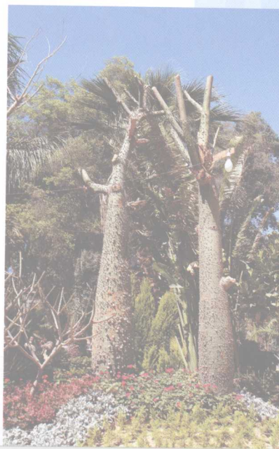
米纳豪斯饭店公园 ■

埃及每年 3 至 5 月间刮“五旬风”(khamusiyye)，风力大，风速惊人，每小时可达 140 公里，风卷沙石，尘烟蔽日，气温可在短时间内骤升 20℃，时断时续，连刮数日，可使人畜患病，农作物受损。