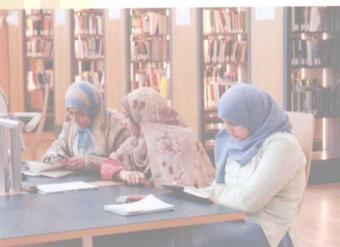
戴面纱的姑娘在学习 ■

或家庭正餐的最后一道菜都是上甜食。著名甜食有“库纳法”、“盖塔伊夫”、“乌姆阿里”等。