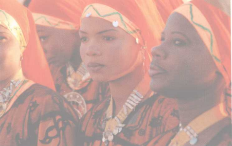
阿斯旺美丽的努比亚少女 ■