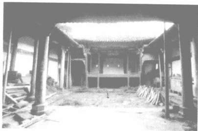
清代石台县珂田乡“崇德堂”戏台 早期常演黄梅戏的戏台之一

一说起源于安徽安庆、怀宁一带。这是就她与“怀宁腔”的关系而言，有人说用怀宁话唱的“黄梅调”叫“怀腔”；而这一带又是一个交通便捷的鱼米之乡，常在黄梅季节以歌舞形式求神禳灾，祈望丰年，当然也唱“怀腔”，便起名“黄梅调”。