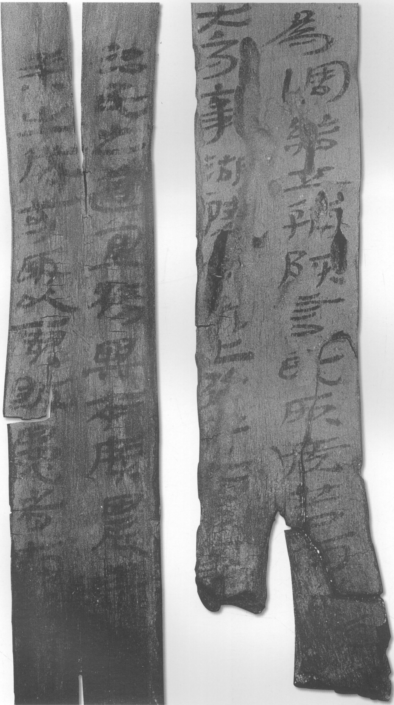
永始三年詔書(局部)