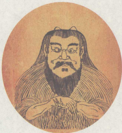
盘古像 此图出自明嘉靖年间王圻父子合编的《三才图会》。神话传说中宇宙原本混沌像一个鸡蛋，盘古开天辟地，形成了世界。

听来也许会令人产生些疑惑，向来令中华民族引以为豪的“具有五千年悠久历史的中华文明”竟然也会遭遇“质疑”？是的，多年来，一直有人宣称这种说法在学术上无法自圆其说。因为文明时代的标志是以国家的出现而确定的，即使我们要以中国历史上最早的朝代夏朝的建立作为中华文明时代的开端的话，那么由夏朝至今，我们也只有四千年的文明史，在此之前的“三皇五帝”之类的传说只能归于“野蛮时代的高级阶段”，不能划到文明时代之中去。至于说有文字记载的历史，则不过三千年左右。然而，作为炎黄子孙的我们还是要考虑到中华民族的历史心理和上古神话体系，说我们有三千年的历史，也并不妨碍说我们有五千年的文明。我们既然能将“三皇五帝”之类的传说归于“野蛮时代的高级阶