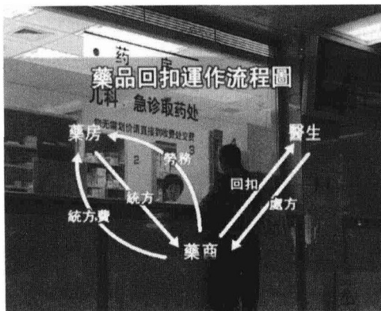
药品回扣运作流程图