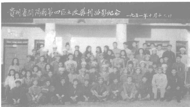
1951年10月贵州省开阳县第四区土地改革胜利留影