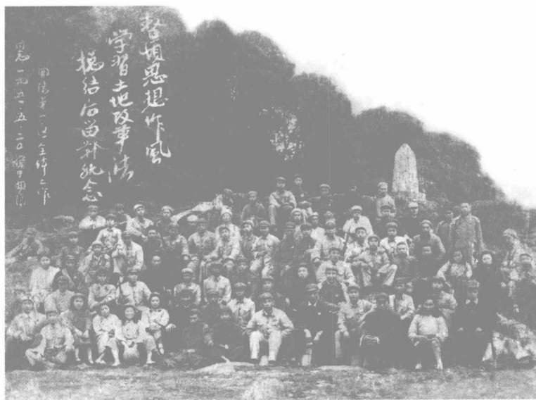
1951年開陽縣第一區全體工作人員學習土地改革法後留影