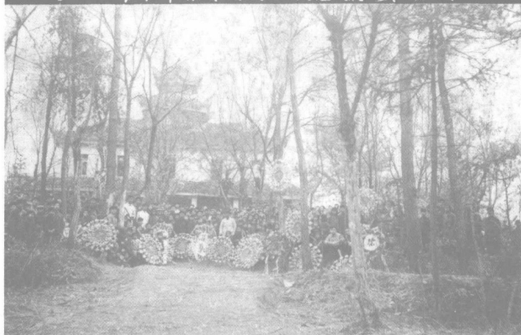
1959年清明節開陽縣機關幹部祭掃烈士墓