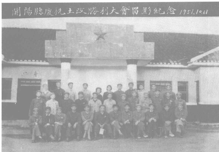
1951年10月开阳县庆祝土地改革胜利大会留影