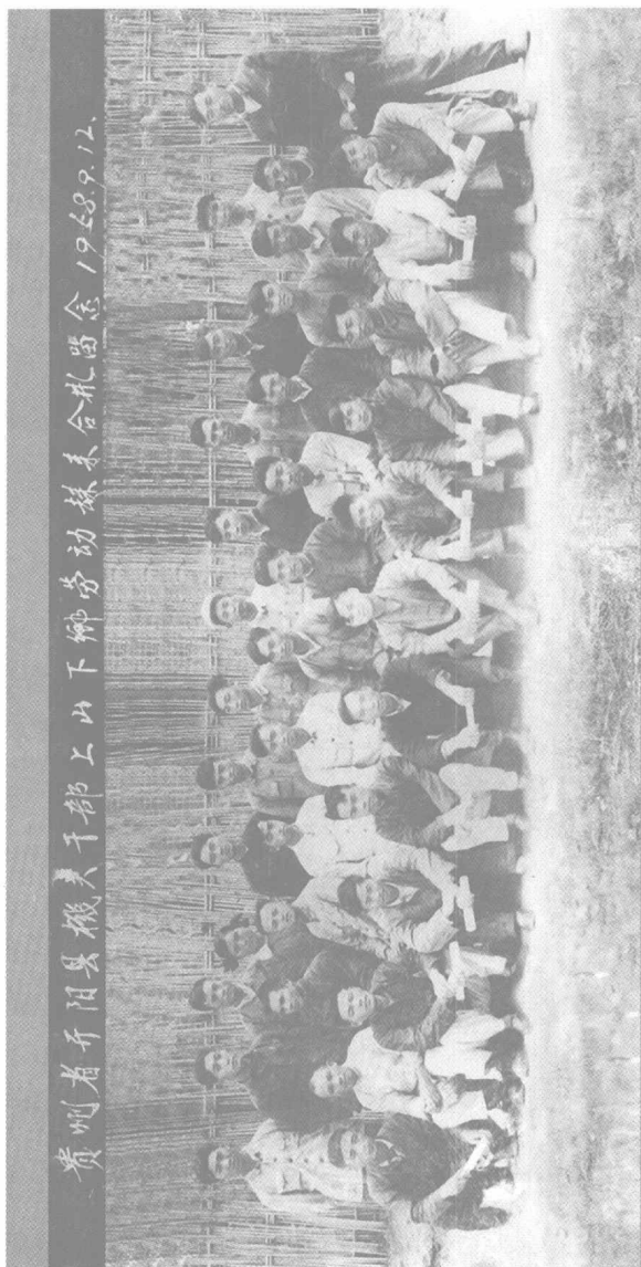
1958年开阳县机关干部上山下乡人员合影