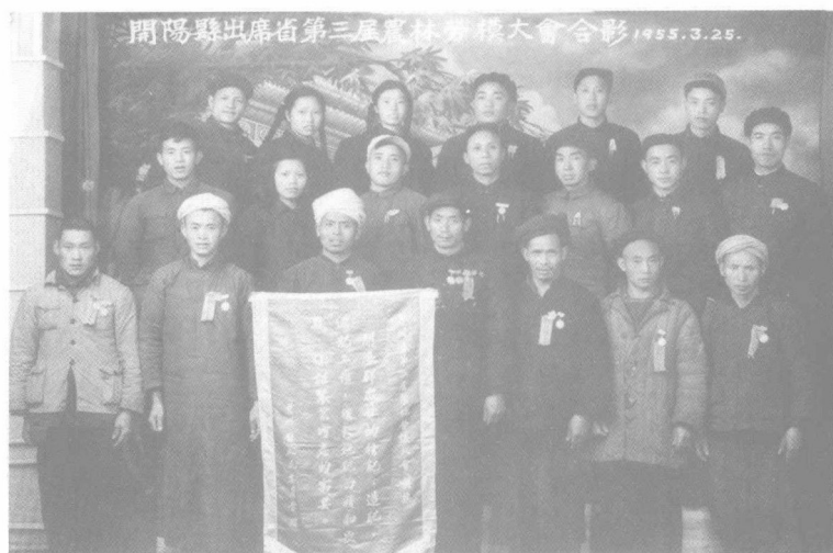
1955年開陽縣出席全省第三屆農業勞動模範大會代表