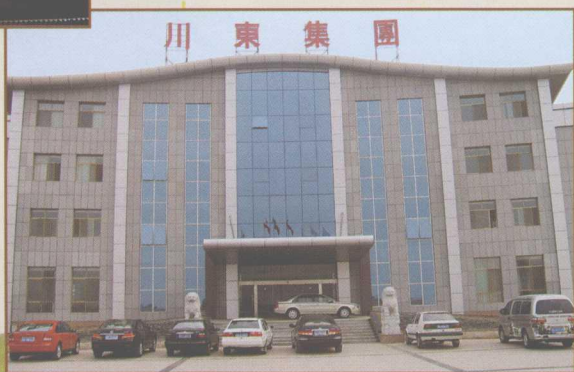
图9 川东集团办公大楼