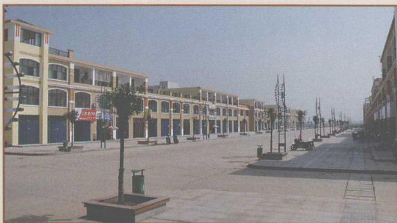
图12 集餐饮、购物、休闲于一体的 “汉正·金天地24小时全 景生活休闲街”风貌