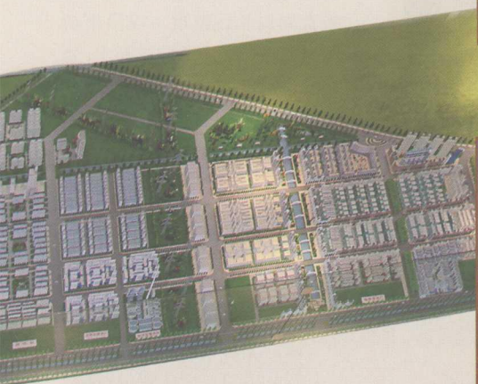
图10 汉正服装工业城项目 总体规划图