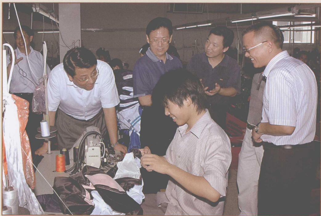
图3 2007年8月8日，湖北省委书记杨松（左二）亲临汉正服装工业城视察并参观入驻企业生产现场，肯定汉正服装工业城“为武汉市汉正街服装生产企业转移以及农村劳动力转移搭建了一个好平台。”