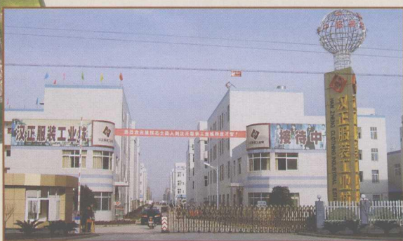
图11 汉正服装工业城南大门