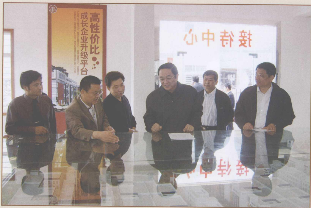
图1 2006年4月3日，中共中央政治局委员、湖北省委书记俞正声（右三）视察汉正服装工业城，在听取公司董事长李志祥（左二）、总经理李文甫（左一）情况汇报后，高度评价汉正服装工业城是“发展武汉城市圈的实践者”