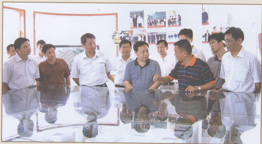
图2 2006年7月20日，湖北省副书记、省长罗清泉（右三）考察汉正服装工业城，叮嘱公司董事长李志祥（右二）、总经理李文甫（左二）说：“这个项目是承接武汉城市圈经济辐射的重要基地，是城市圈发展的重要节点，要加快建设。”