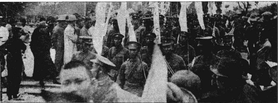
广州各界在第一公园(今人民公园)集会追悼孙中山先生