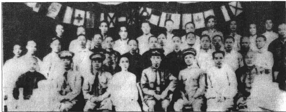
各界人士欢迎东征军