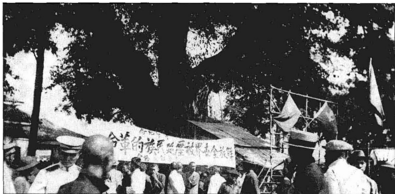
1924年11月7日，广州各界群众举行庆祝俄国十月革命胜利纪念大会