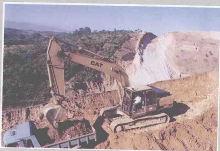
1993年9月 12日桂林两江国际 机场道路正式 开工建设。