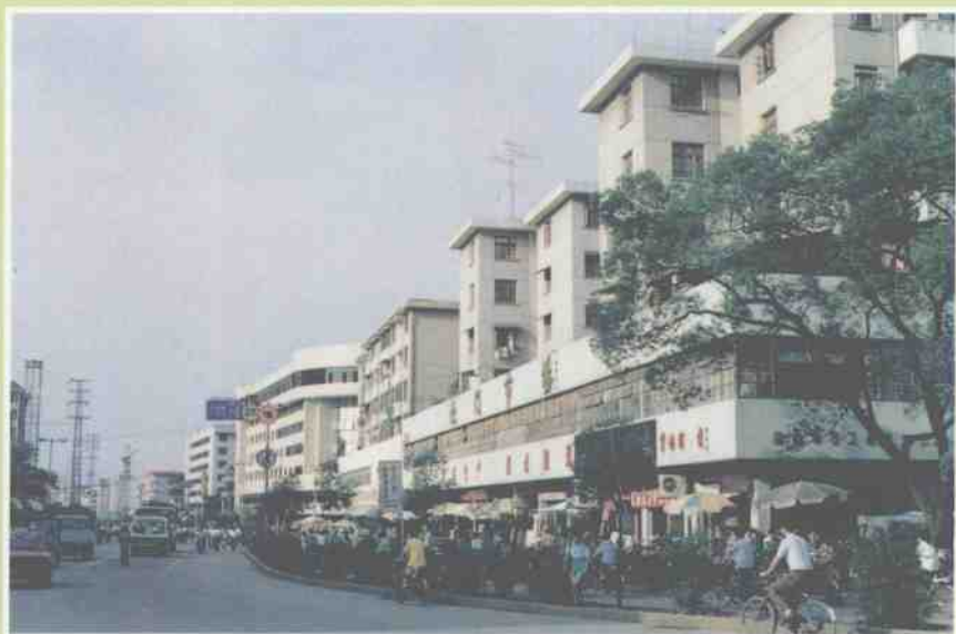
新建成的桂林王城商厦外景。