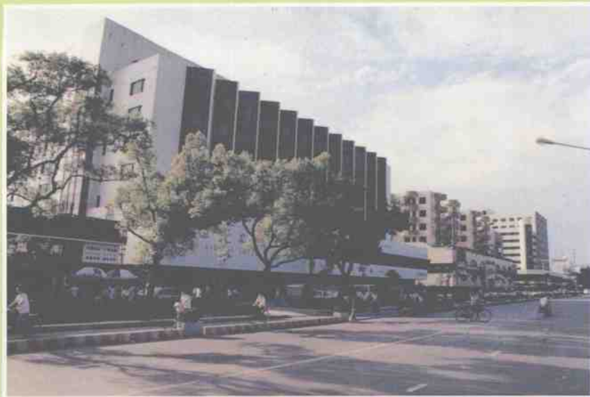
新建成的中山南路东侧商业街一角。