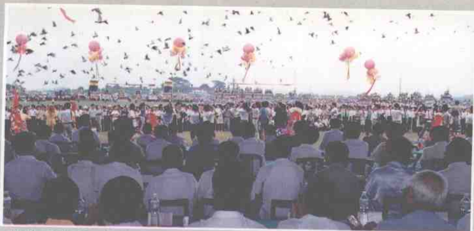
1993年7月28日桂林两江国际机场开工典礼隆重举行。