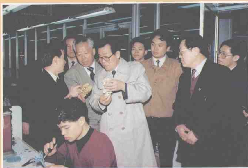
1993年4月 14日全国政协主席李瑞环在桂林 金元珠宝集团公司考察。