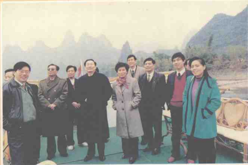
1993年1月8日国务院副总理朱镕基考察漓江。