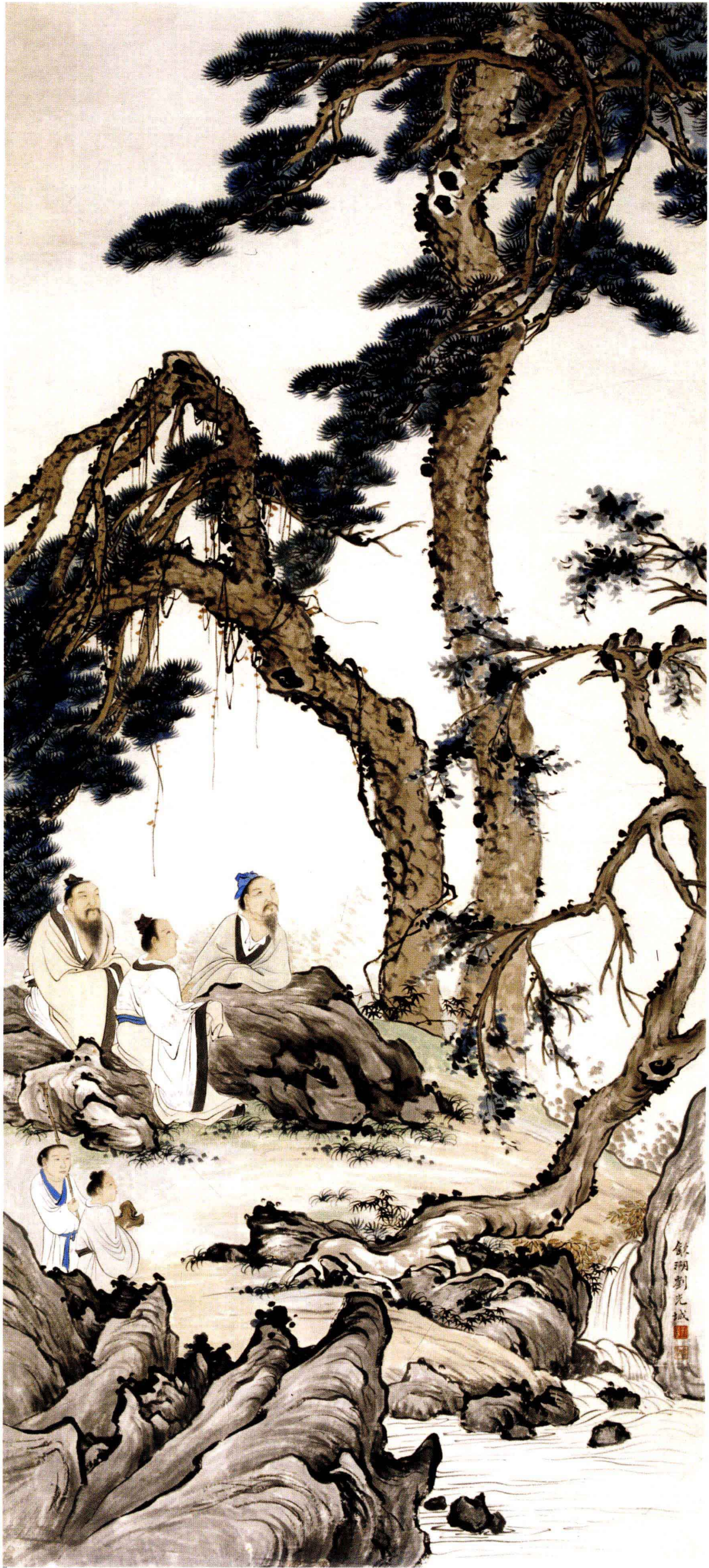
图 12. 仿新罗山人 68cm × 152cm