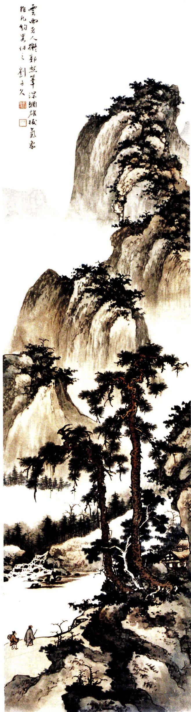
图4. 山水四条之三 32cm × 124cm