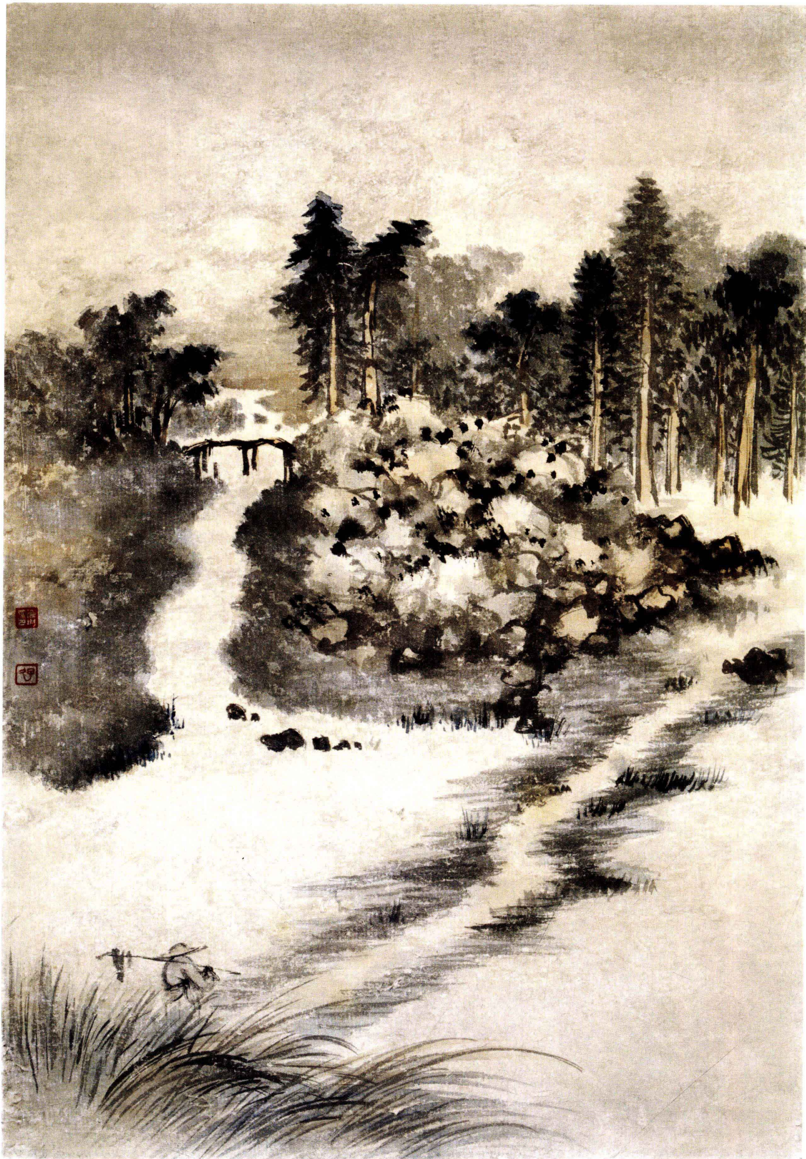
图 13. 溪水清清 33cm × 48cm