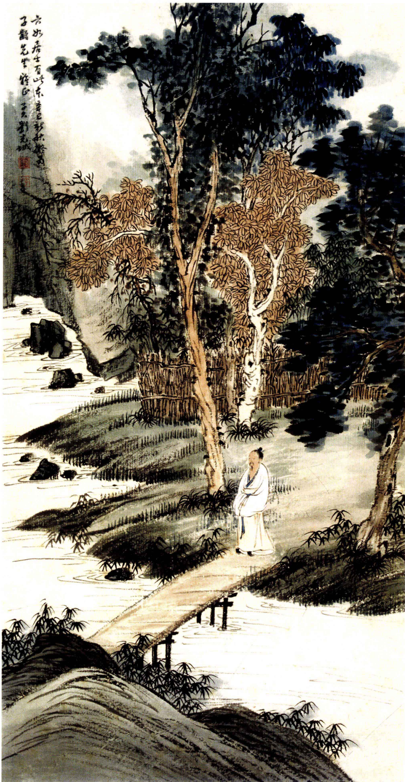
图1. 秋风拂面过小桥 27cm × 53cm