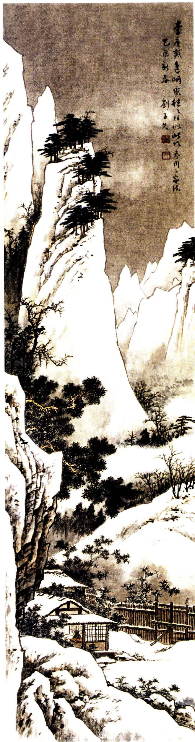
图5. 山水四条之四 32cm × 124cm