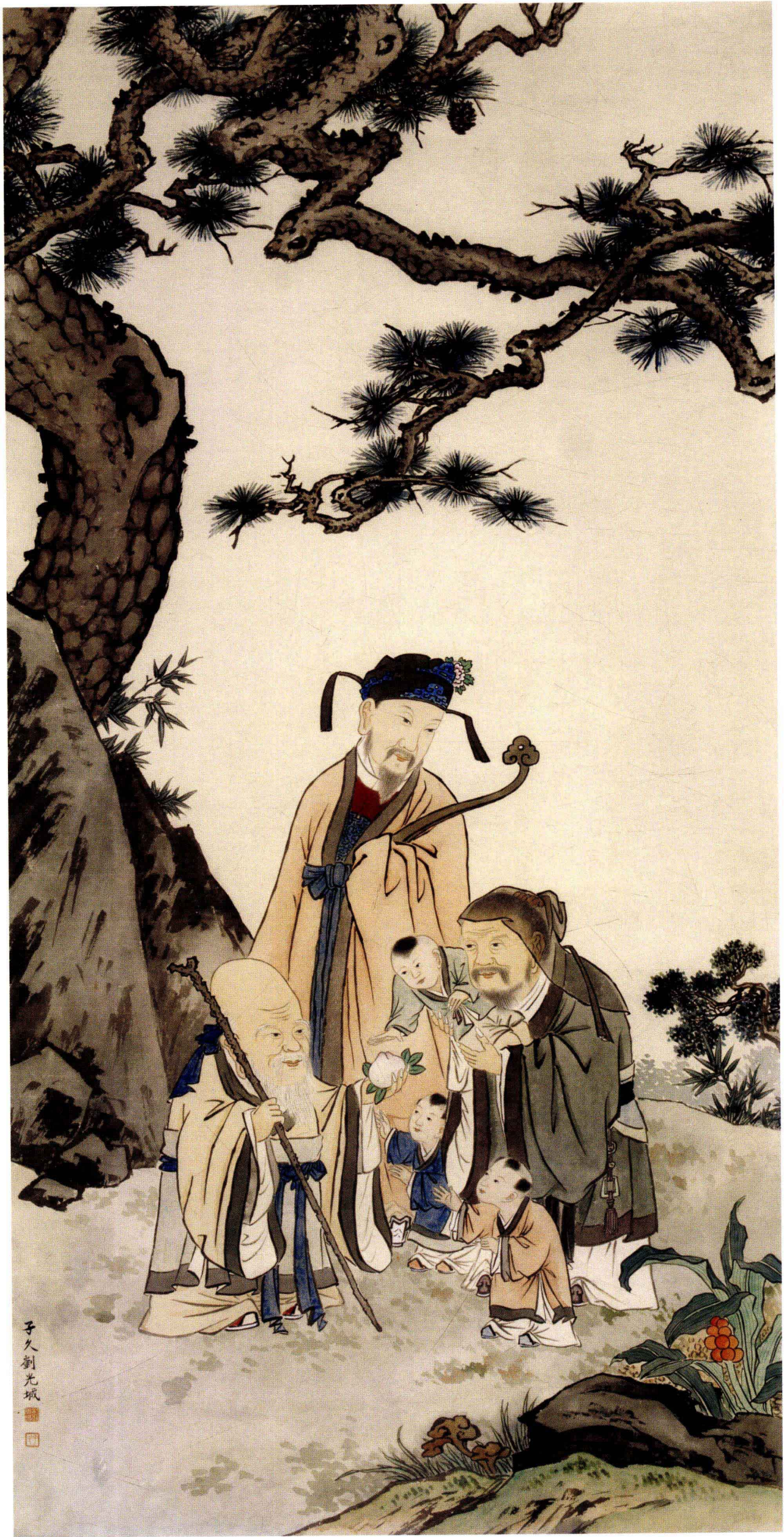
图 14. 三星图 68cm × 135cm