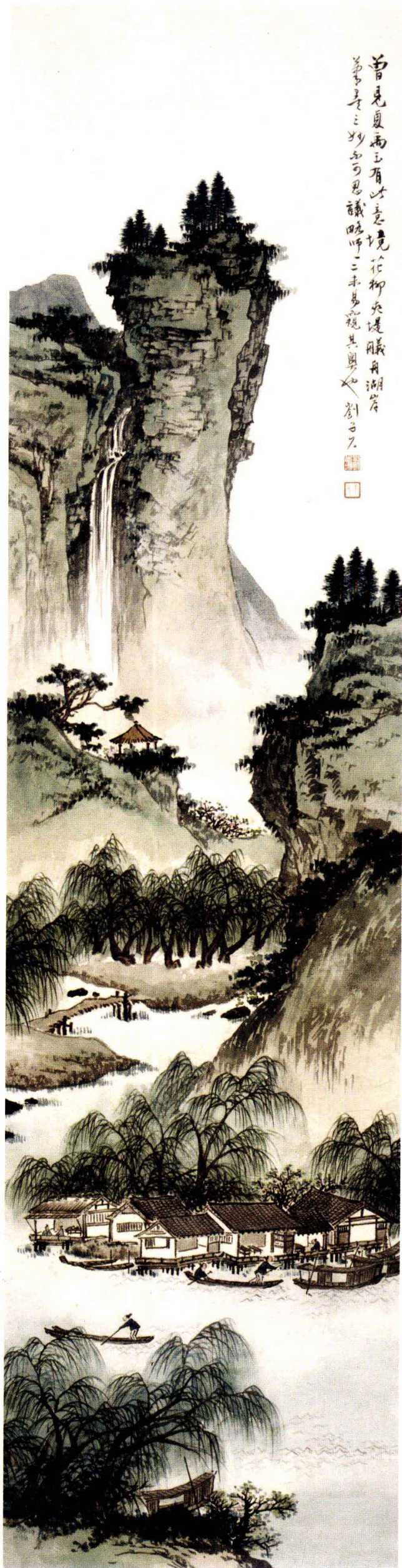
图2. 山水四条之一 32cm × 124cm