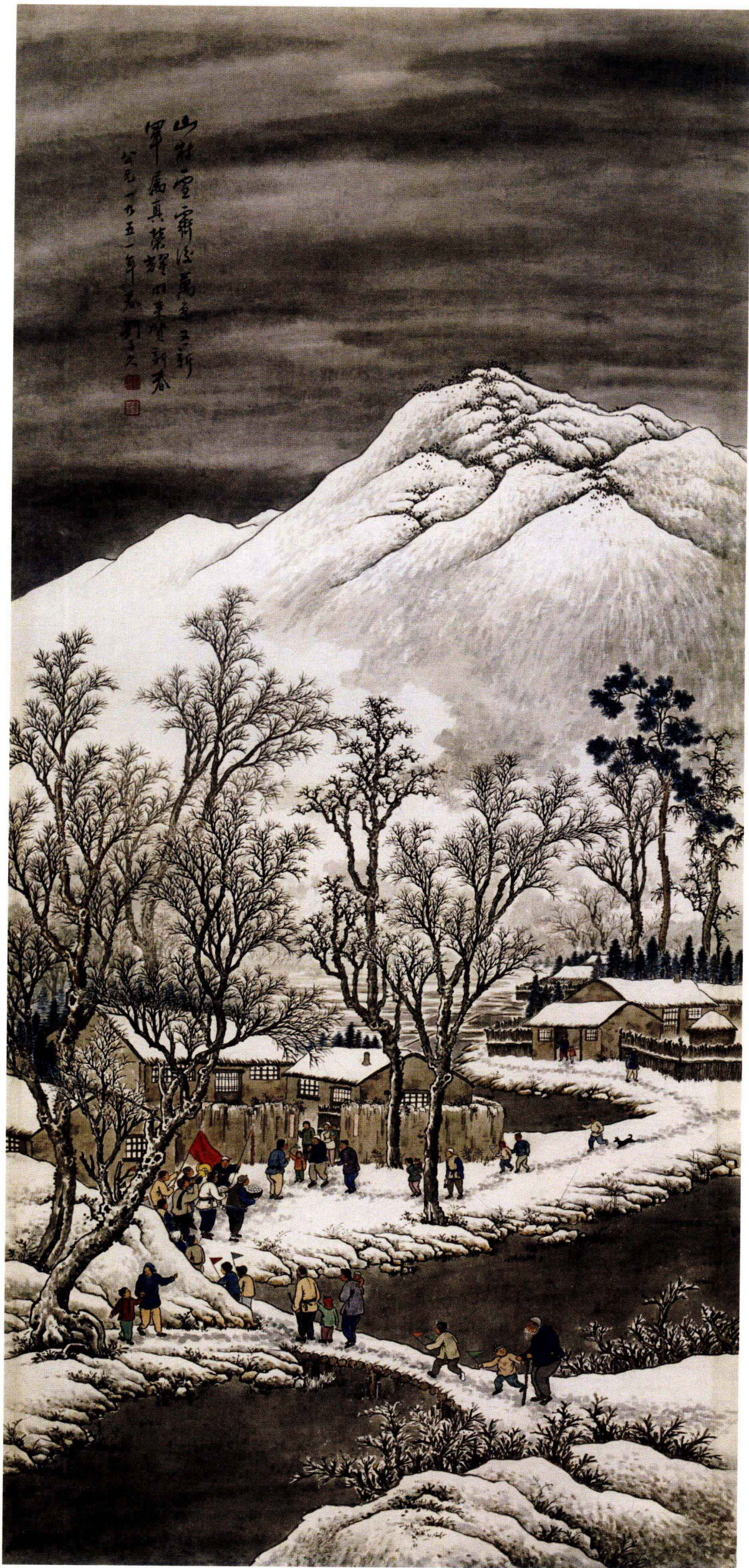
图 15. 给军属拜年 59cm × 128cm