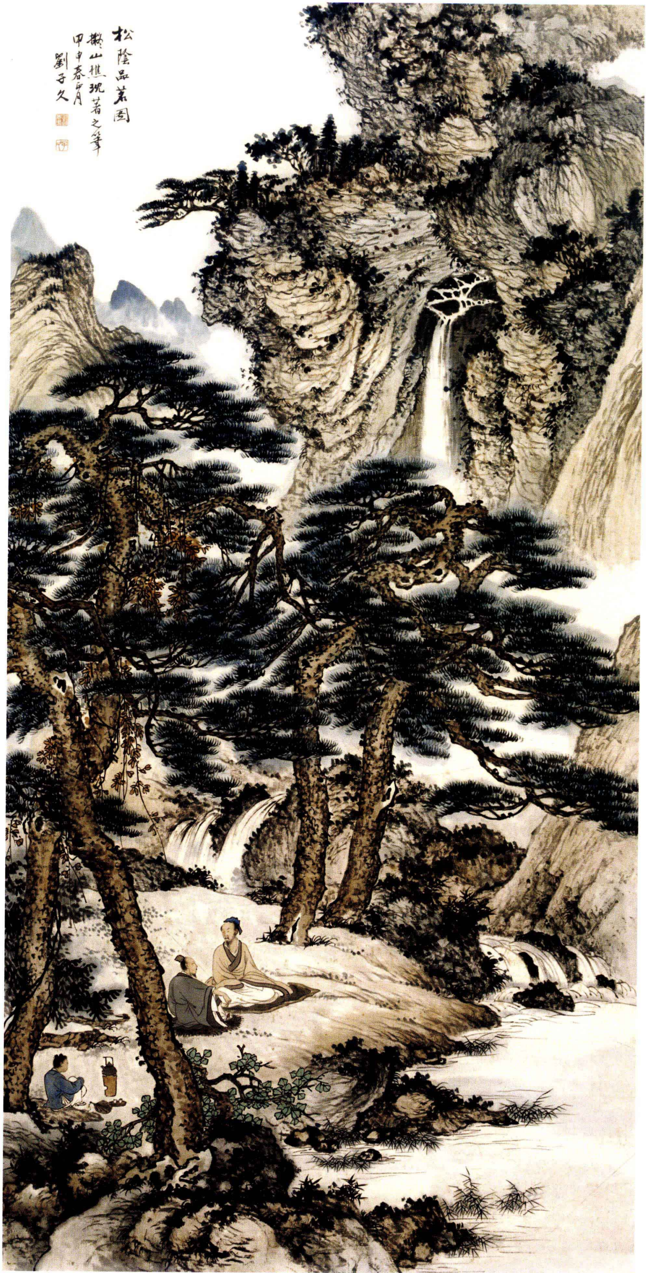
图6. 松阴品茗图 66cm × 135cm