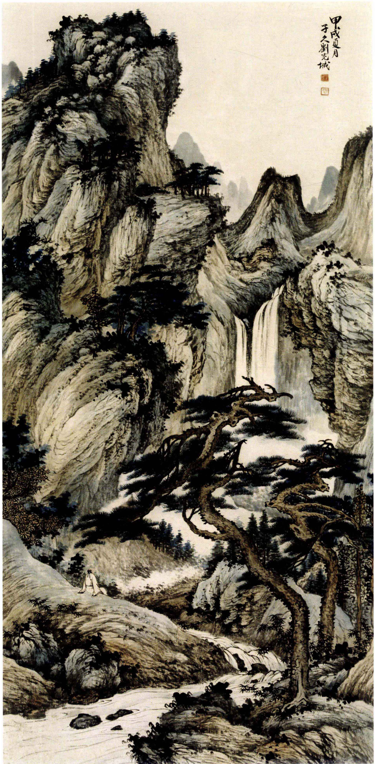
图8. 观瀑听松 56cm × 118cm