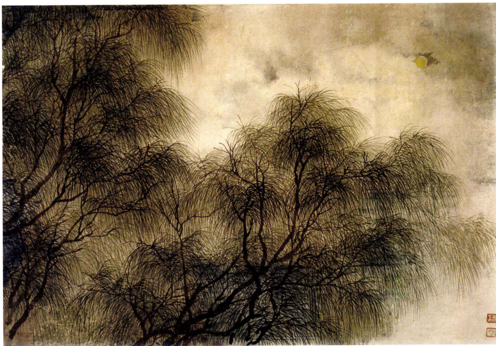
图10. 柳 48cm × 33cm