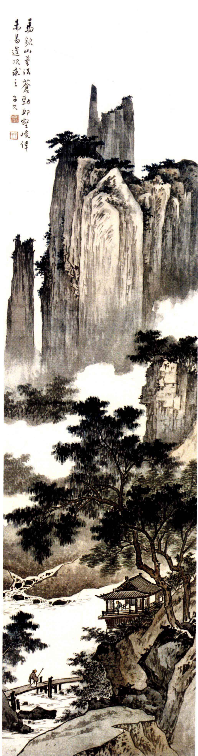
图3. 山水四条之二 32cm × 124cm