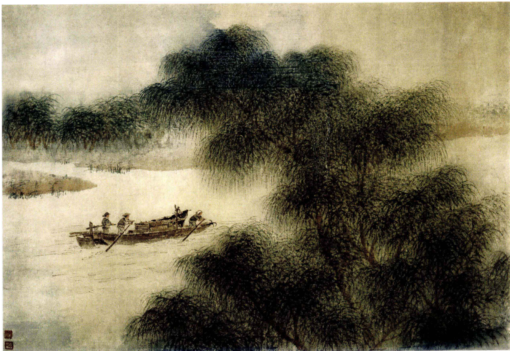
图9. 泛舟 48cm × 33cm