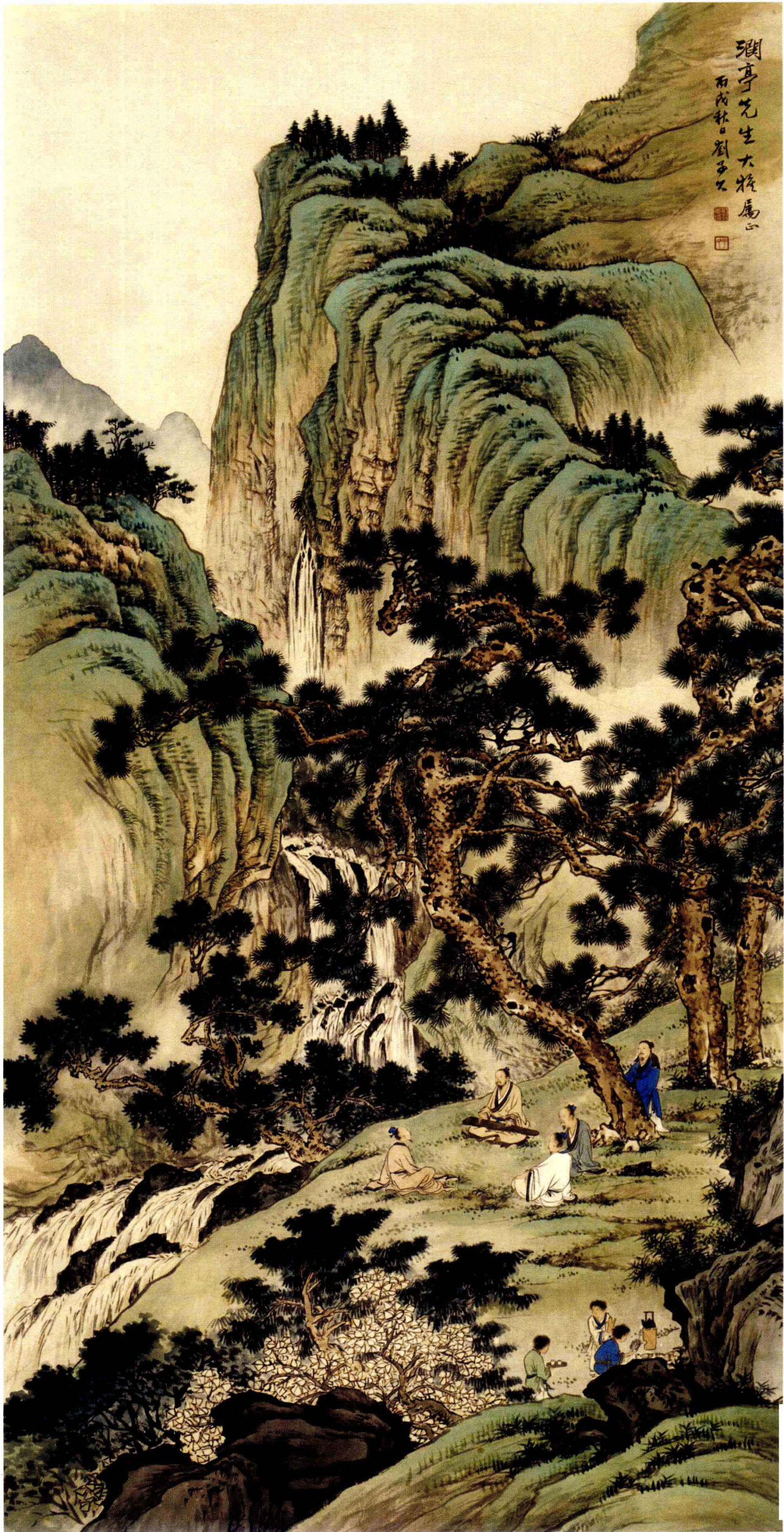
图7. 林阴听琴图 70cm × 140cm