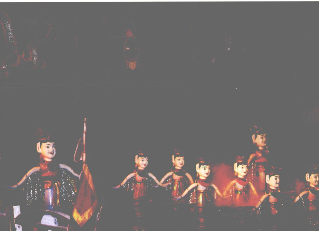
越南国粹——水上木偶戏