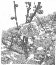
友情像花儿一样美丽

我们盼望在同学中建立新的友谊,希望和朋友一起成长,那就要珍视新友谊。制作一个名片,彼此交流,了解同学的兴趣和爱好,了解自己和哪位同学是同一个月出生的,了解自己和哪位同学的家离得最近,这样可以很快地和新同学一起学习、一起探索、一起玩耍、一起参加活动、一起放学回家。从新同学变成老朋友,让我们共同成长、共同进步,度过初中三年的美好时光,升入理想的高中。