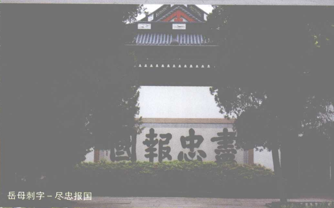
岳母刺字 - 尽忠报国