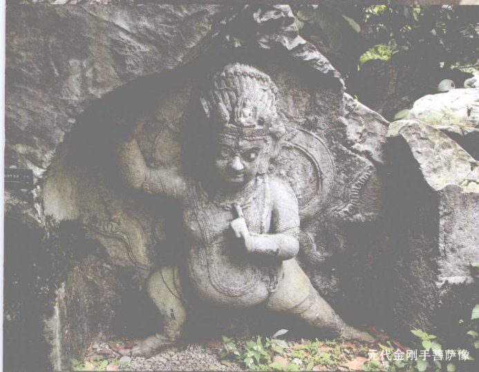
元代金刚手菩萨像