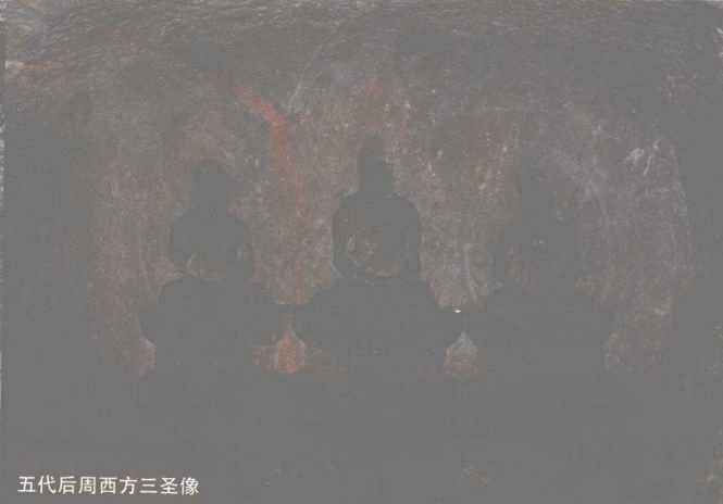
五代后周西方三圣像