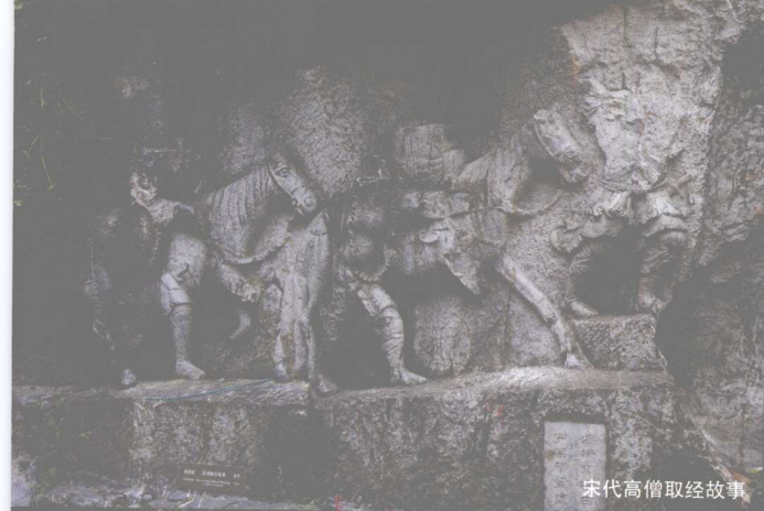
宋代高僧取经故事