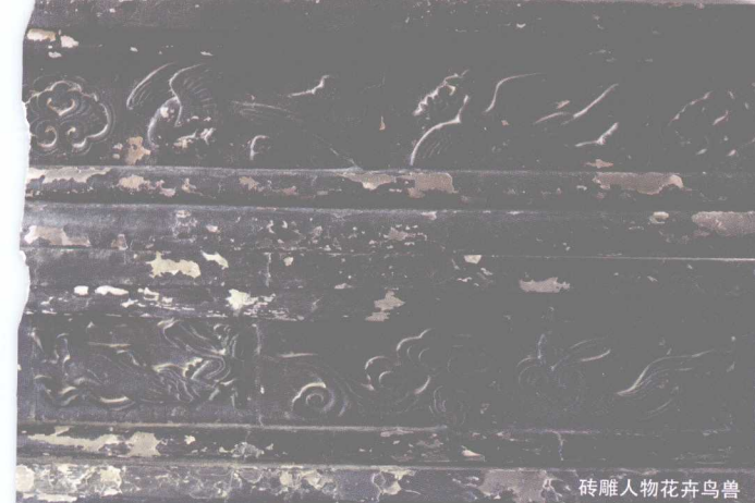
砖雕人物花卉鸟兽