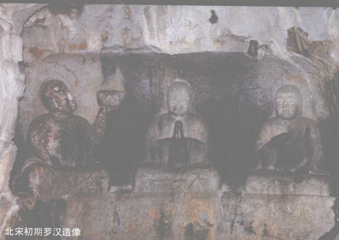
北宋初期罗汉造像