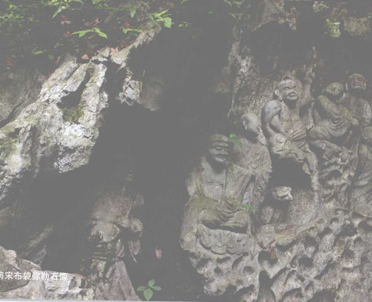
南宋布袋弥勒石像