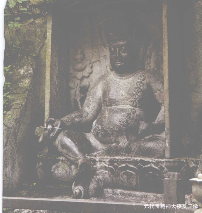
元代宝藏神大夜叉王像