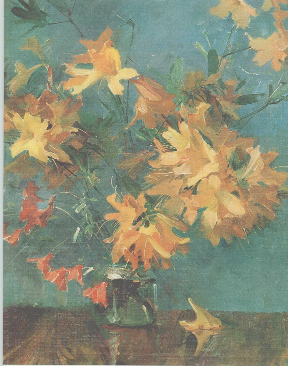
武夷山上的黄杜鹃