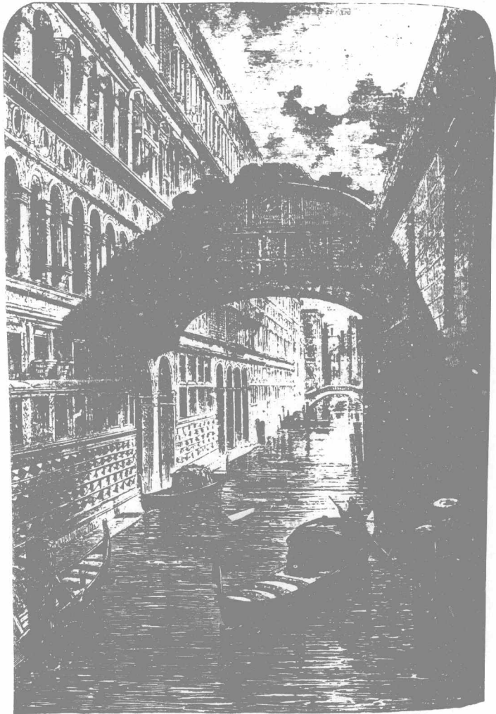
圖 城 斯 尼 維 利