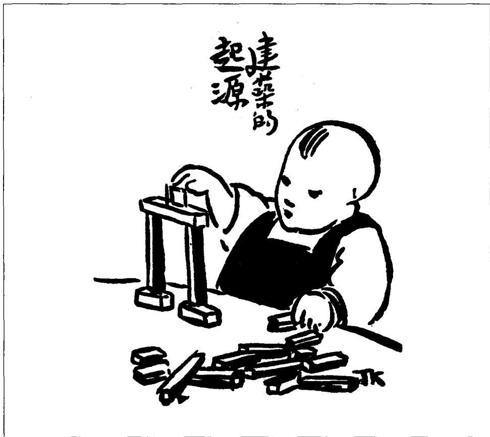
建筑的起源 丰子恺