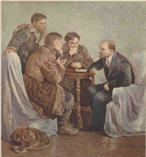
1 刺绣 列宁和农民谈话