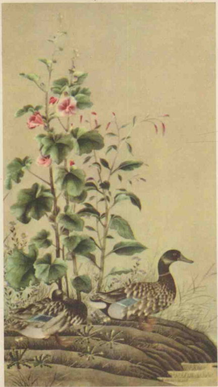
4 刺绣 双鸭