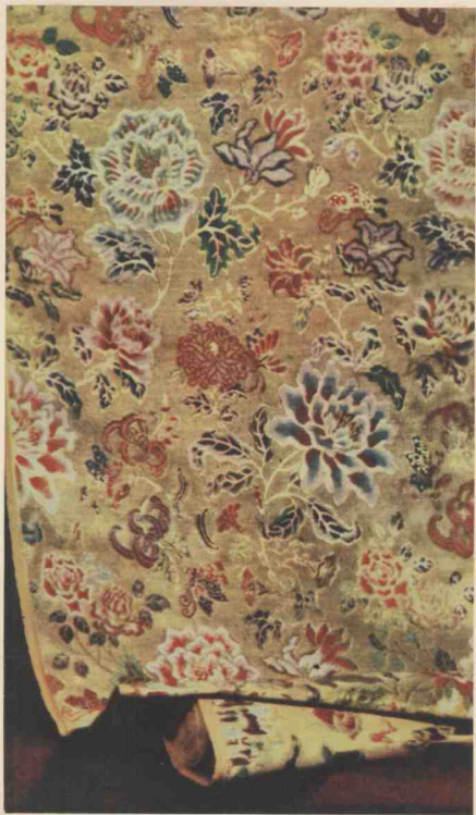
8 云锦 百花齐放—金宝地