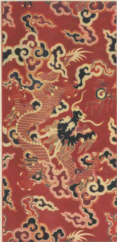
6 云锦 大龙