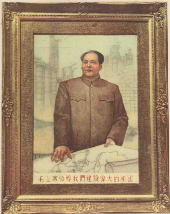
2 刺繡 毛主席領導我們建設偉大的祖國