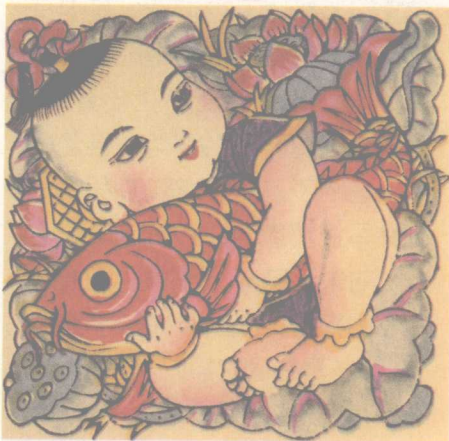
■ 连年有余 年画

最早的年画是门神画。南朝梁人宗懔的《荆楚岁时记》载：“正月一日，绘二神贴户左右，左神荼，右郁垒，俗称之门神。”民间传说神荼、郁垒是两兄弟，有驱鬼之威力，人们把两兄弟的像挂在门上，以求除祸消灾。到了唐代，人们将门神改为武将秦叔宝和尉迟敬德。《三教搜神大全》载：“户神，唐秦叔宝、尉迟敬德二将军也。……唐太宗不豫，寝门外鬼魅呼号，太宗以告群臣。秦叔宝奏曰：‘愿同尉迟敬德戎装立门外以伺。’太宗准其奏，夜果无事。固命画工绘二人之像于门，