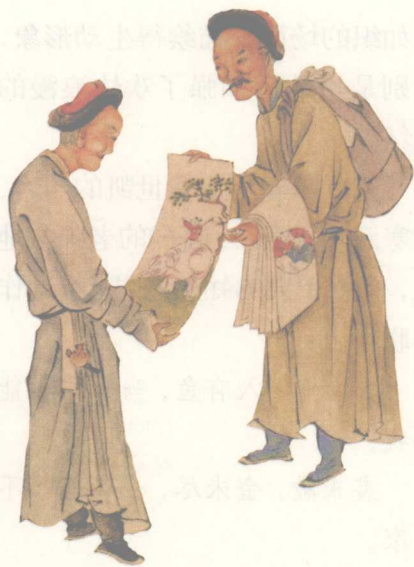
■ 买年画 清 《太平欢乐图》

古代“贴春牌”即是将“福”字写在红纸上贴于门上，民间则有倒贴“福”字的习俗，意为春节福到。据说有一年，明太祖朱元璋准备用“福”字作暗记杀人。马皇后知道后，为消除这场灾祸，令全城百姓必须在天明之前在自家门上贴上一个“福”字。于是，城内家家门上都贴了“福”字。其中有人家不识字，竟把“福”字贴倒了。第二天，皇帝派人上街查看，发现家家都贴了“福”字，甚至还有人贴倒了，不禁大怒，立即命令御林军把那家满门抄斩。马皇后连忙对朱元璋说：“那家人知道陛下今日来访，故意把“福”字贴倒了，这不是福到之意吗？”朱元璋一听有道理，便下令放人，一场大祸终于消除了。从此，人们便将“福”字倒贴起来，一求吉利，二为纪念马皇后。