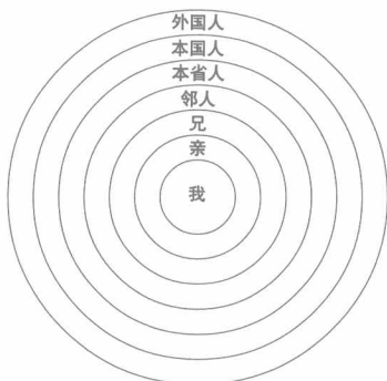
图一 孟子的性善图