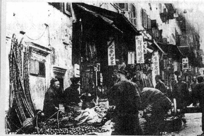
晚清遗风。街市一角(1870年摄)。

第二年(1901年),清政府与侵略者订了丧权辱国的《辛丑条约》。那慈禧太后与光绪帝回到京城。大局定后,有人向慈禧建议:去年停