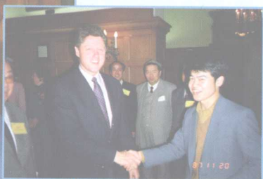
安迪和SOHO 董事长潘石屹