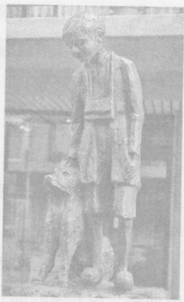
◆霍布肯的尼洛塑像

有个叫尼洛的孤儿，从小跟姥爷生活在安特卫普的霍布肯。他偶然救活了几乎被人虐待致死的大狗帕奇，跟它成为好友。尼洛是个绘画天才，深爱磨坊主的女儿阿洛伊斯，磨坊主却嫌他穷，不许女儿跟他来往。圣诞节即将到来，姥爷不幸去