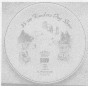
◆ 佛兰德斯的狗的故事瓷盘