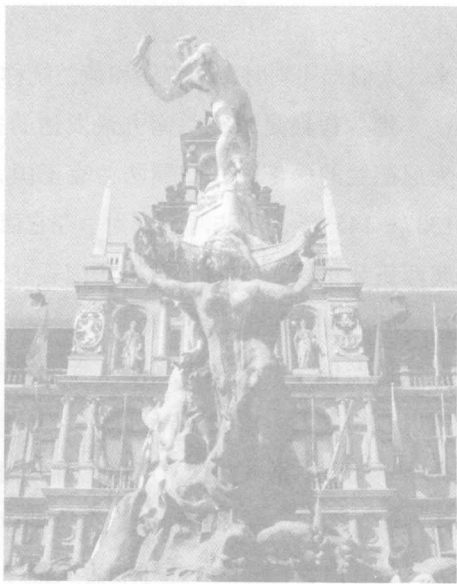
◆布拉博抛出断手的铜像