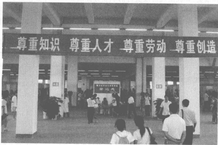
图0-1 人才招聘会现场

参加招聘会的毕业生来自四川省各大高校,素质能力较好的毕业生纷纷通过了企业选拔,而有些人往往因为个人素质问题而就业困难。