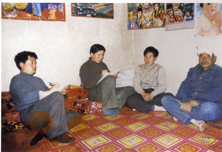
在陕西老乡家中写生