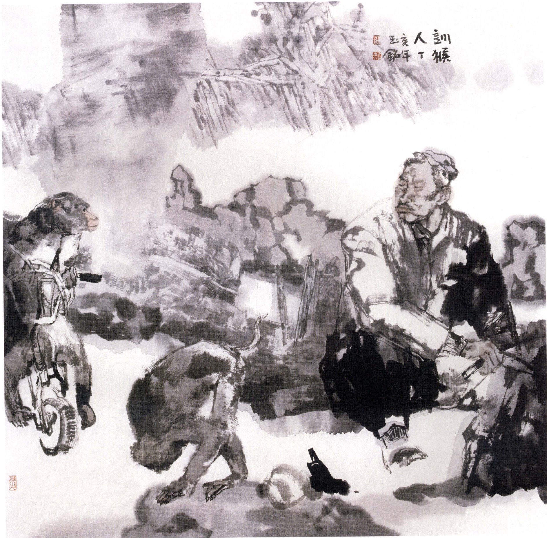
训猴人 67cm × 67cm