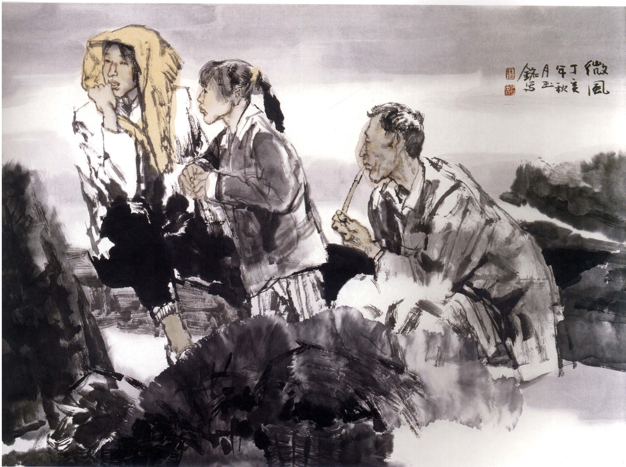
微风 48cm × 71cm