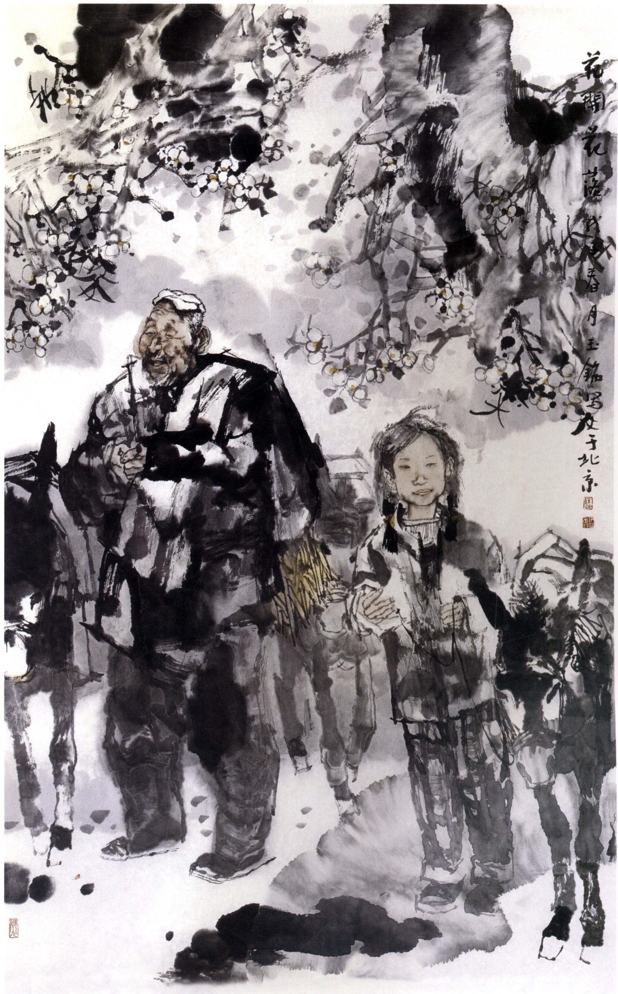
花开花落 97cm x 65cm