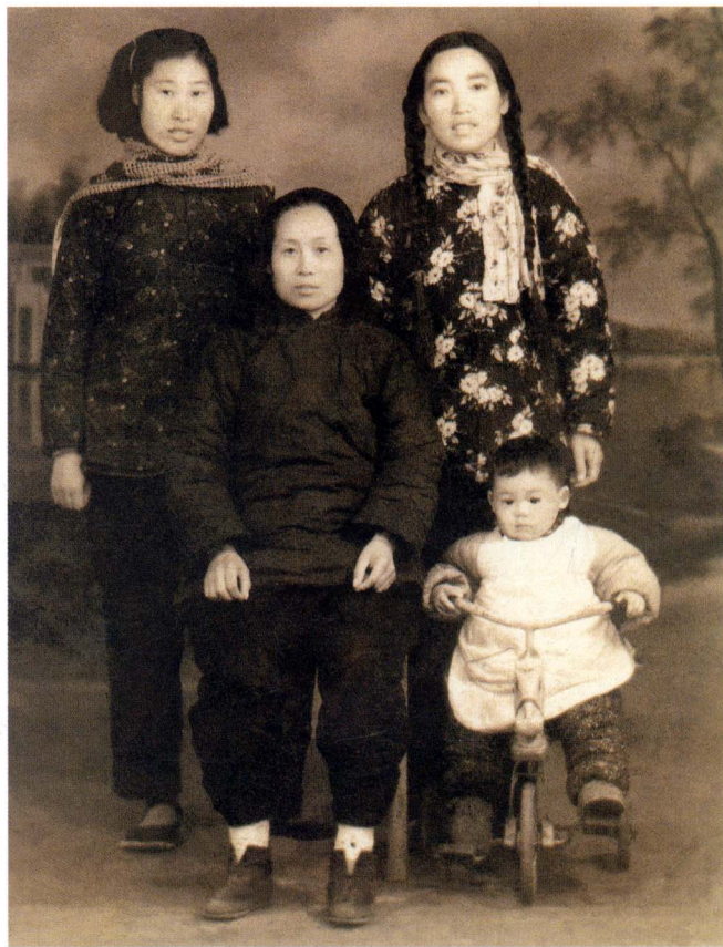
和养母留下的唯一一张合影

我曾请朋友治印一方,印文为“灈水人”。灈水是条小河,它的发源地是孟津县,流经洛阳城北的邙山,由东关老城汇入洛水,相传为大禹治水的第一条河。童年时的灈河很美,水清且浅,春夏猛涨,漫及堤岸。那时河的岸边有古柳、水车、菜园子。小河涨水可以抓到不少小鱼。它曾是我童年伙伴的天堂。灈河东岸是回族区,因而左邻右舍多是回族。我有不少同学和朋友都信仰伊斯兰教。这些邻居大都是社会底层的贫苦人,拉板车的车夫、卖牛血的小贩、做洛阳铲的铁匠,他们干着最苦最累的活。他们为人豪爽、善良、真诚。谁家婚丧嫁娶,整个巷子的人都会来帮忙。每当回民过他们