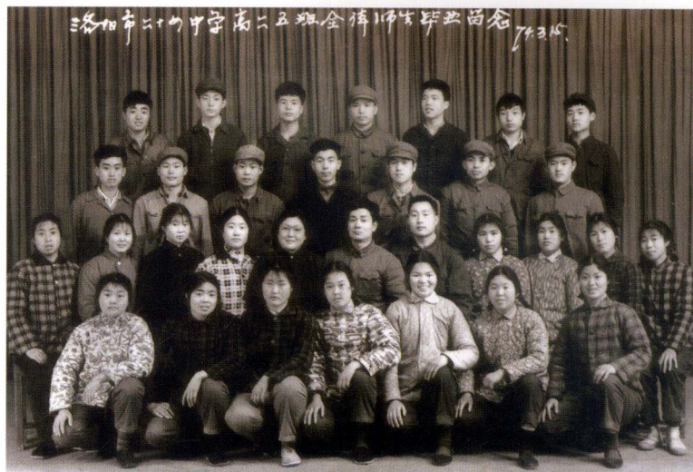
高中毕业时和老师、同学的合影，我在最后一排最边上

儿时，在养母老家住过一段时间，那是我一生中玩得最开心的时光，也成为我后来绘画取之不竭的源泉。我的小品画里的人物形象，以及村庄、田野、桃花、毛驴、荷叶，那些憨厚的农人的生活情态，大都来自于那个美丽的世界。那个地方地处河南舞阳县城不远的一个小村庄，门前一条小河缓缓地流过，河里有摸也摸不完的小鱼小虾，河岸的湿地长着大片大片的草，开着各种