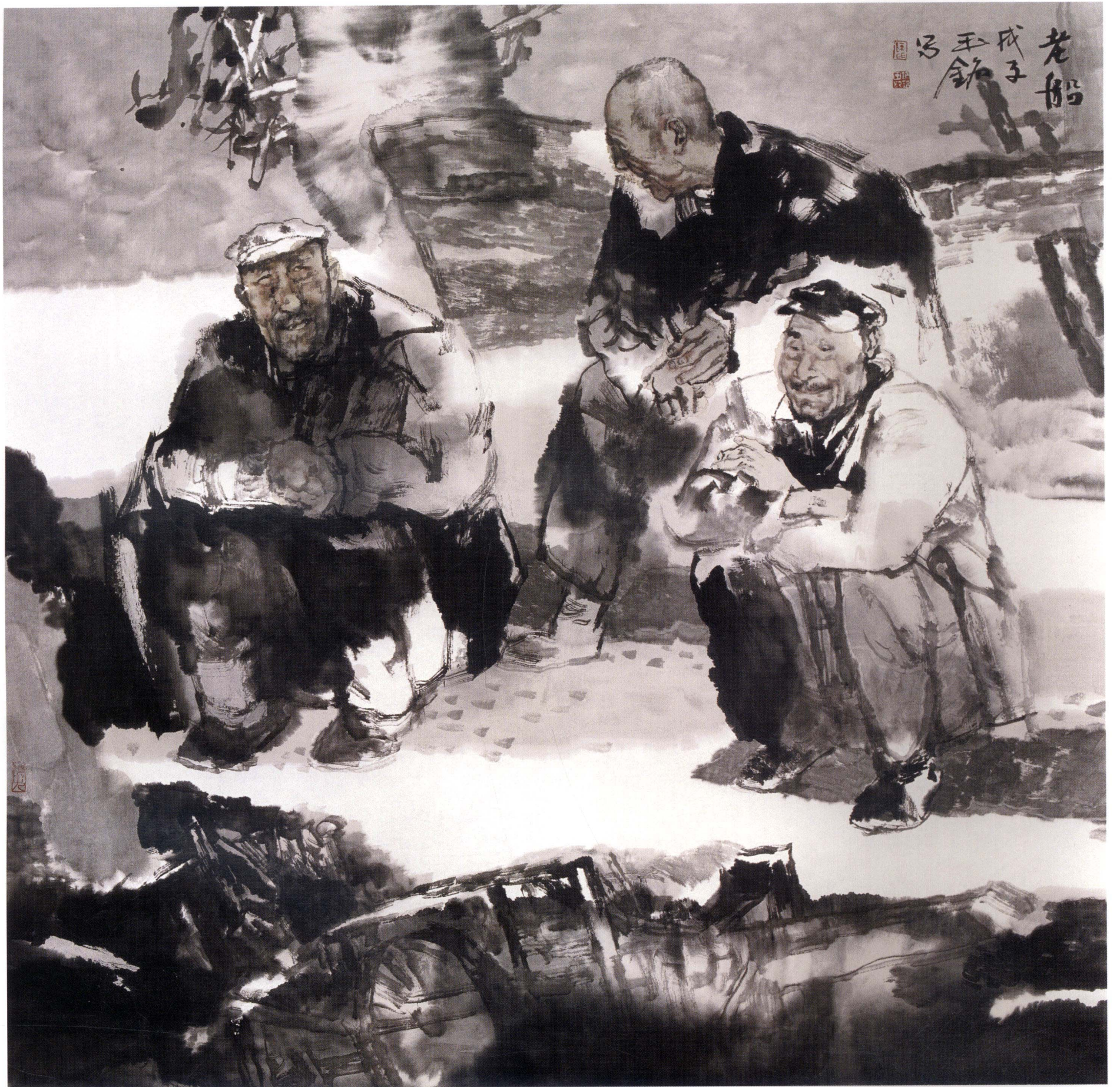
老船 67cm × 67cm