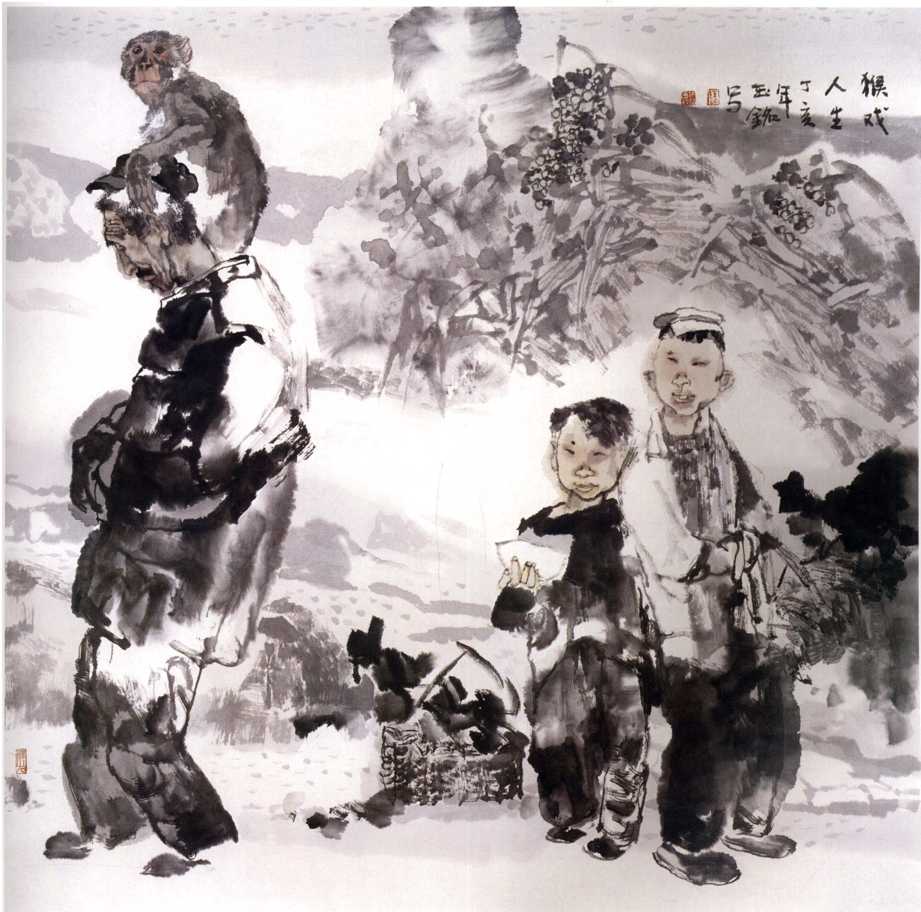
猴戏人生 67cm × 67cm