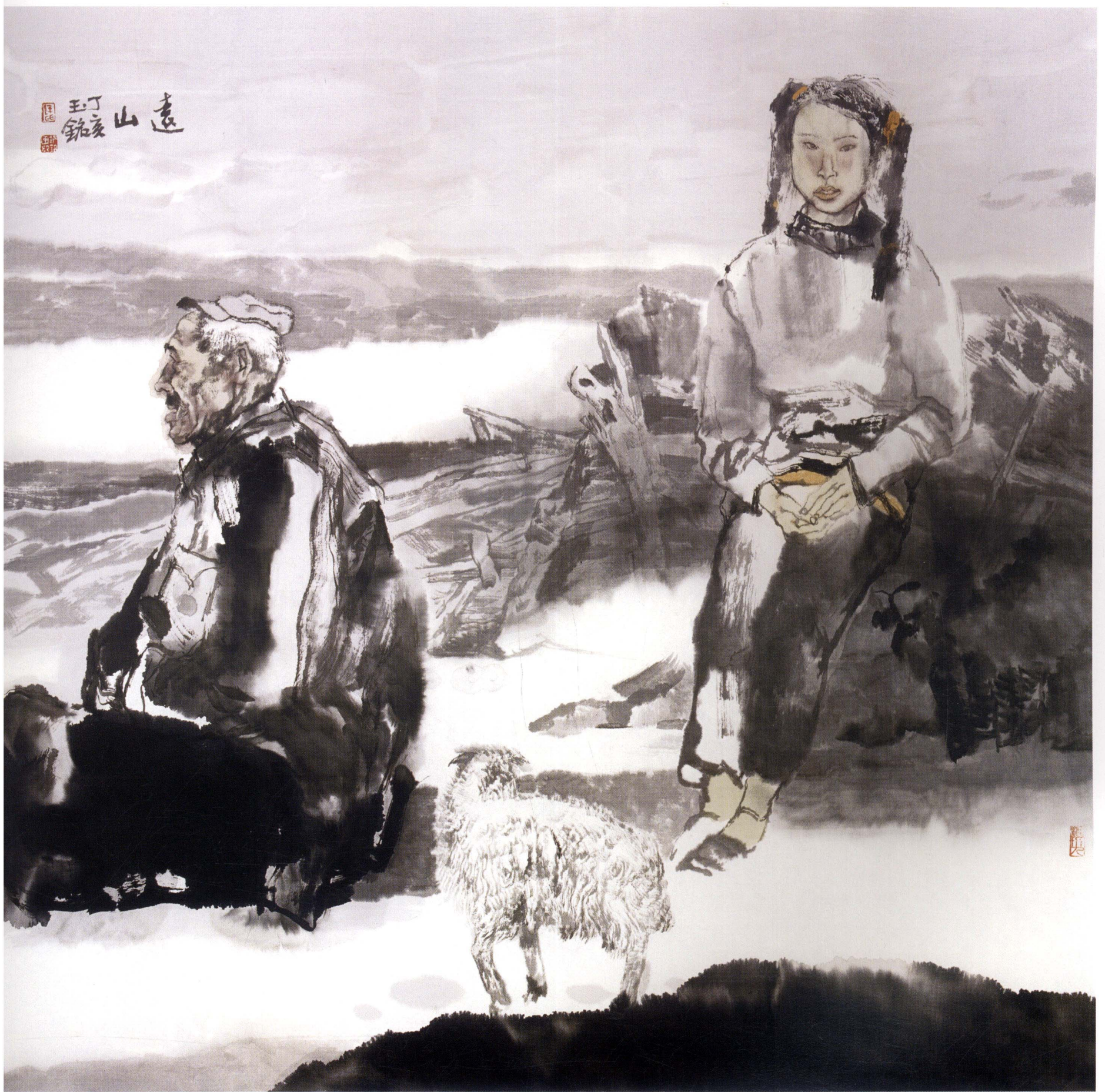
远山 67cm × 67cm