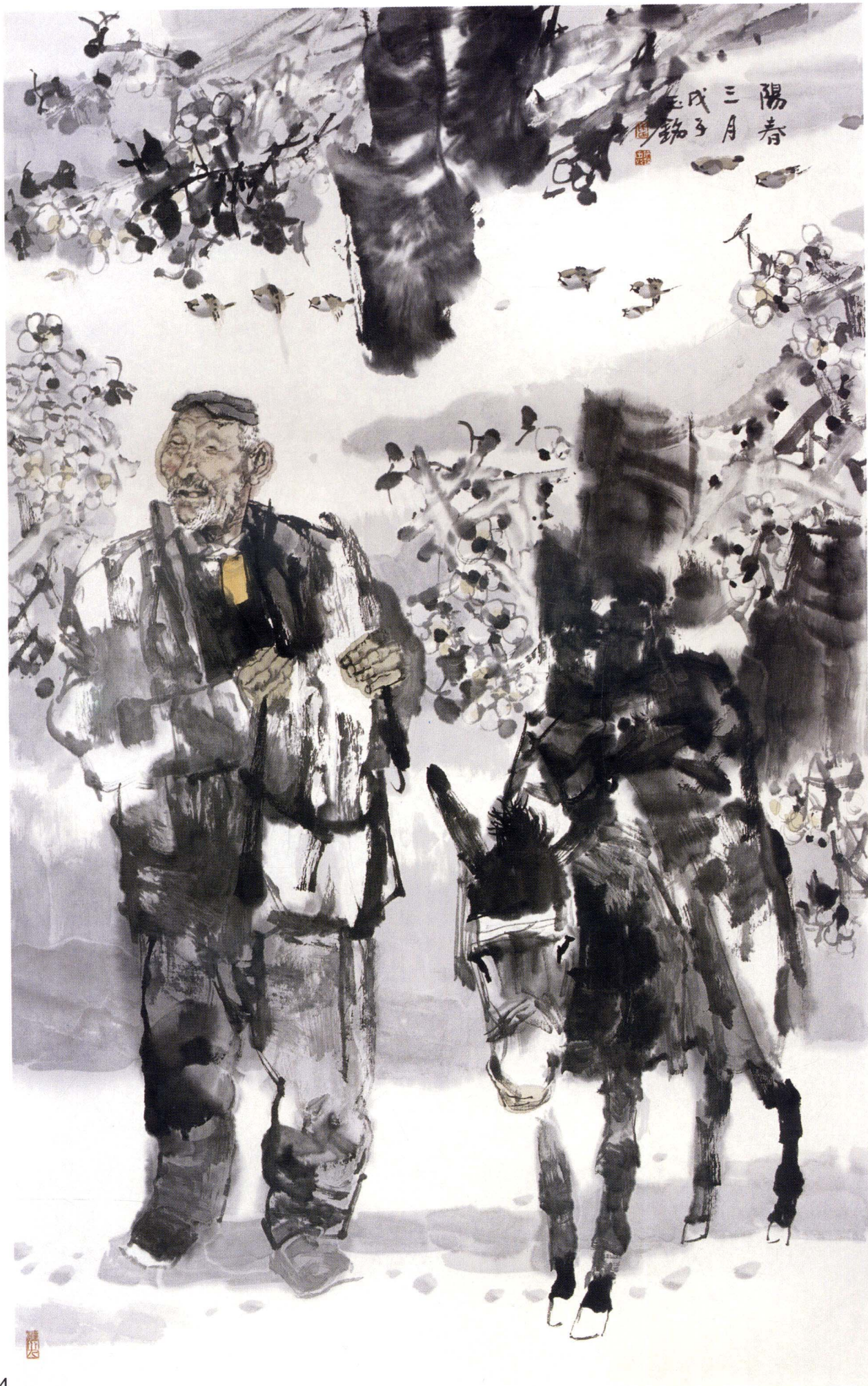
阳春三月 97cm x 66cm