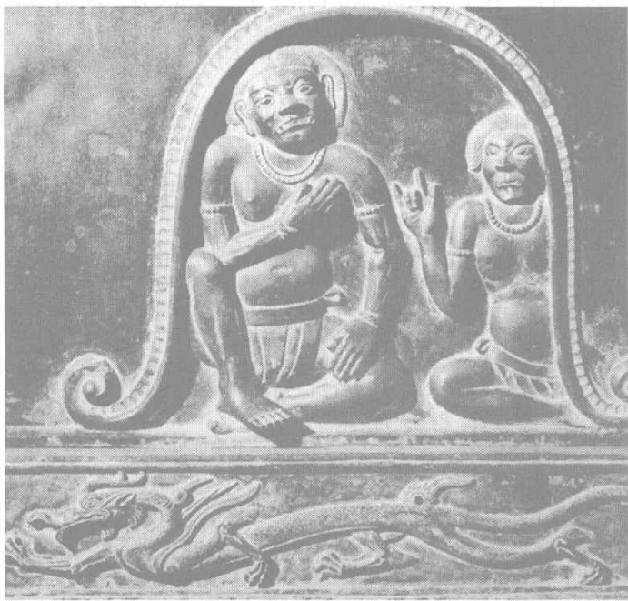
图 0-02 药师如来像座台上的龙

20世纪后半期，在东北亚地区发现了多处绘有四神壁画的墓葬，再度引起日本学者对于四神的研究兴趣。1989年春天，在《东アジアの古代文化》（大和书房出版）第59号，羽床正明发表了《四神信仰の伝来と归化人》一文。此文考察了各种出土物，把四神信仰在东北亚的流传分为三期：第一期为公元5世