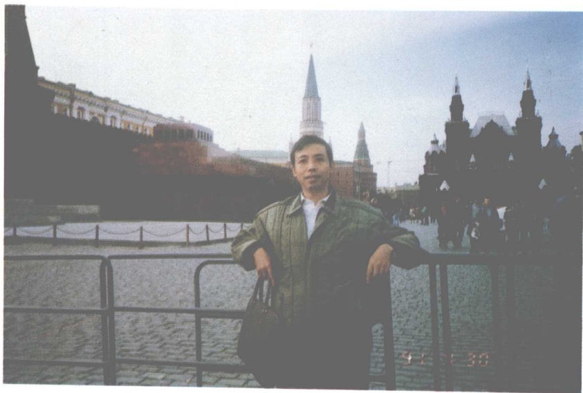
庞中华在莫斯科红场。创作有组诗《莫斯科诗抄》(1991年)。