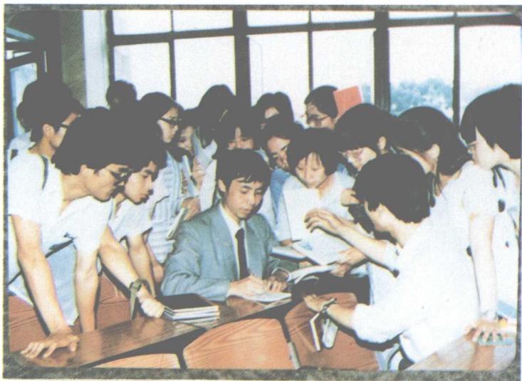
庞中华在年轻朋友之中(1987年)。