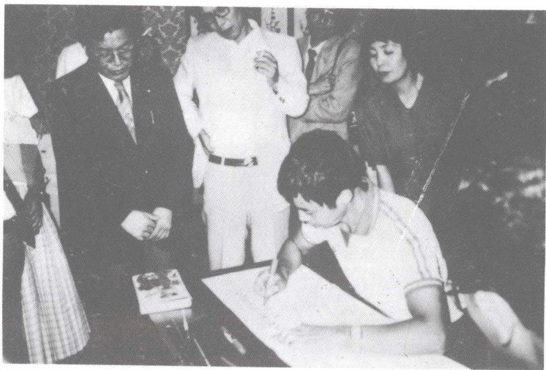
庞中华在日本书道学院题词。创作有《赠日本友人》等诗(1987年)。