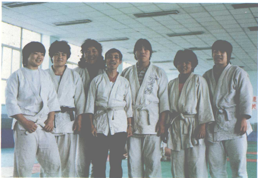
庞中华和女子柔道队的世界冠军们在一起(1987年)。