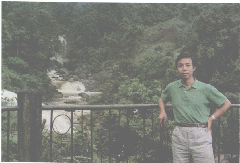
庞中华在云南。《绿色的江南》部分诗篇写于此 (1990年)。