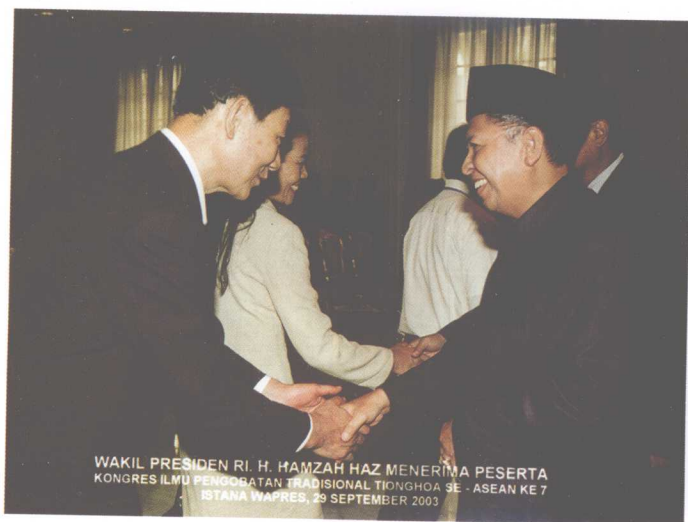
作者在印尼接受印尼副总统和卫生部长接见