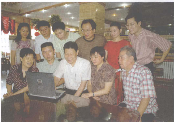
主编封进启与编委会成员正在研讨