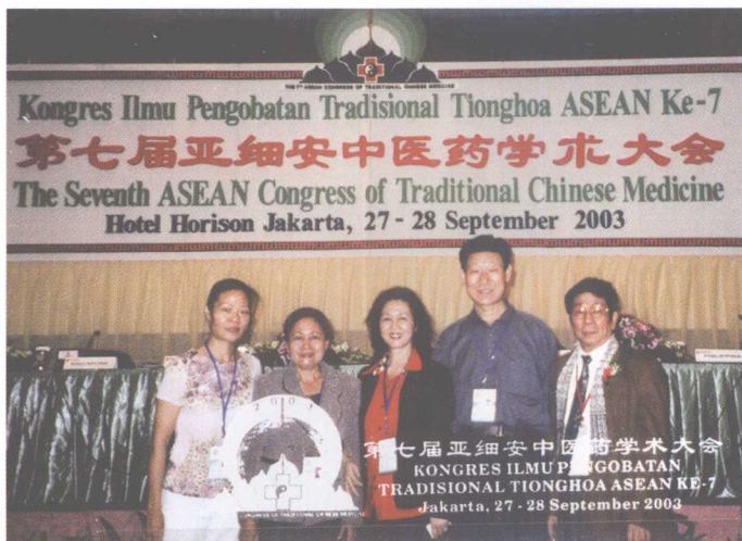
作者与印尼泗水中医协会负责人在国际会议上