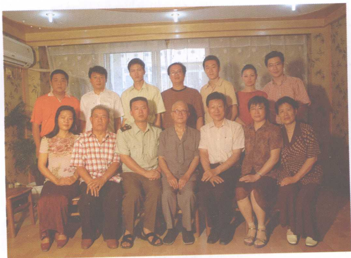
编委会部分成员合影