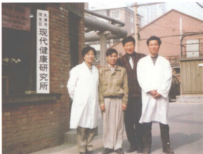
1996年创建现代健康研究所