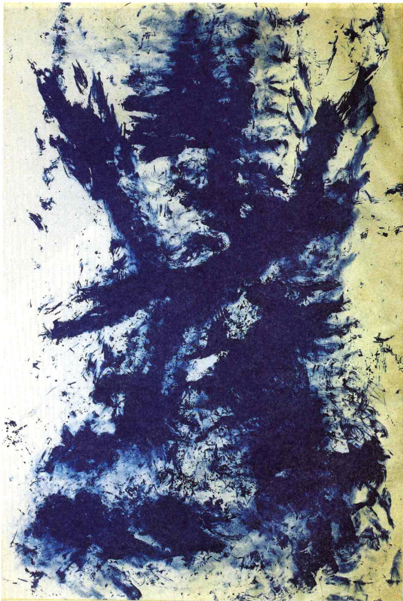
★《人体测量学》，伊夫·克莱因（1960年）

为了完成这幅作品，艺术家首先在裸体模特身上涂满蓝色颜料，然后让她们躺在铺在地上的画布上滚动，她们身体所及之处便形成了这一幅画作。