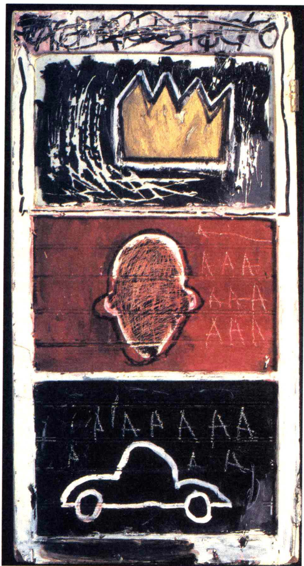
★ 《成功》，让·米歇尔·巴斯奎特 (1980年)

14岁的巴斯奎特俨然已是一个叛逆少年。父亲杰勒德·巴斯奎特把他和两个姐姐带到了波多黎各,并在那里整整呆了两年。从这时起,巴斯奎特便不断地上演着反叛与离家出走的闹剧。16岁时,他们搬回纽约。父亲将他送到美国友好学校就读。这是一所专门招收天资聪颖但不善学习的孩子的学校,该校依托于城市中的博物馆开展实用教学。尽管学校生活无拘无束,可巴斯奎