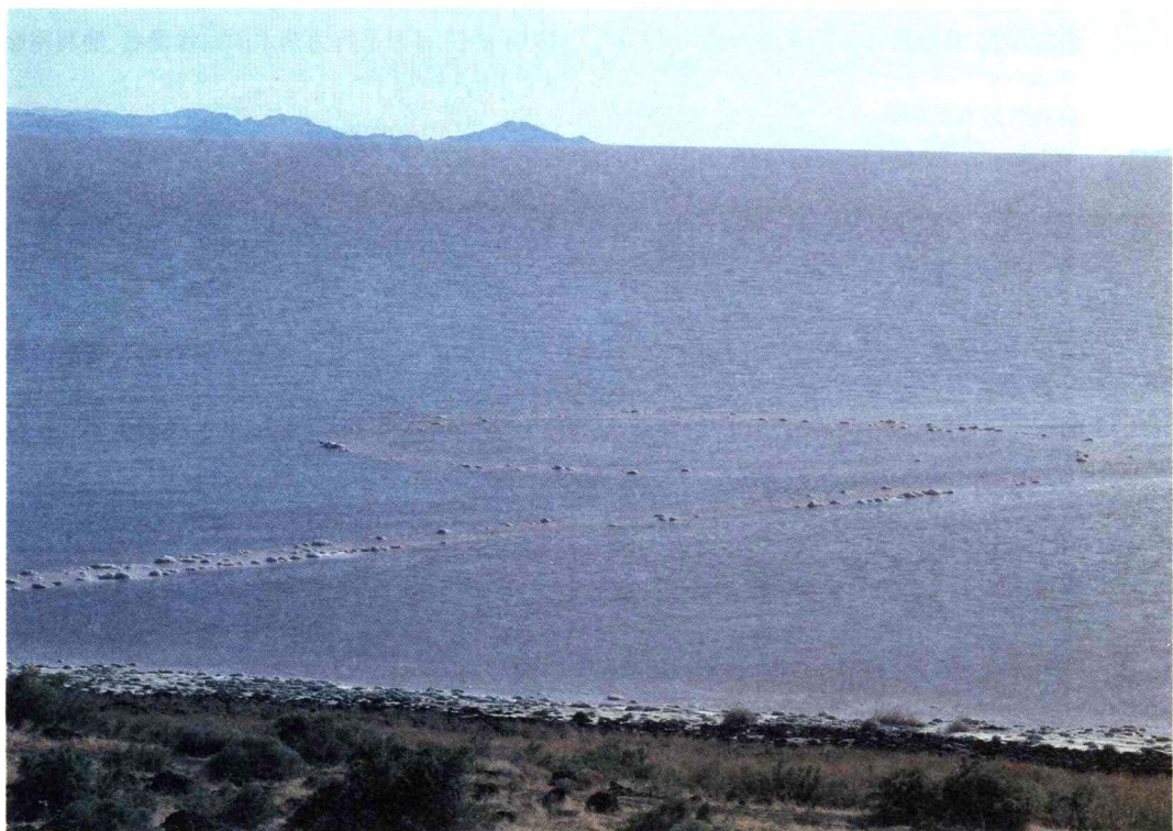
★《螺旋形防波堤》,罗伯特·史密森(1970年)

保加利亚艺术家克里斯托(1935~ )热衷于露天装置艺术的创作。他的很多作品都是令人