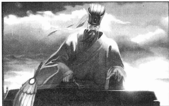
诸葛抚琴退司马（图3）