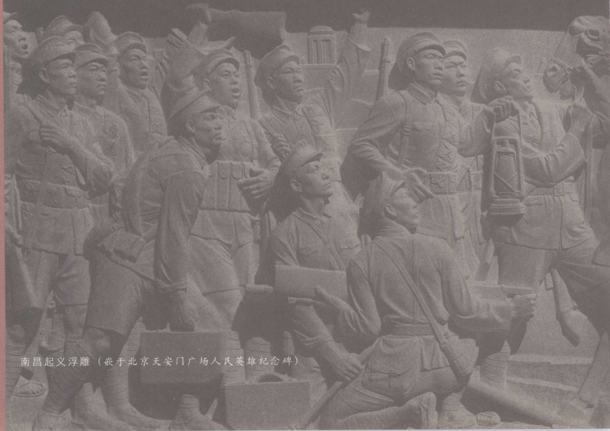
南昌起义浮雕（嵌于北京天安门广场人民英雄纪念碑）

但当时的现实是，面对血腥的压力，其实只有放弃和流血两条路。放弃和流血可能都会走向死亡，而后者却