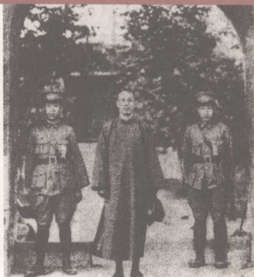
蒋介石在南昌司令部留影