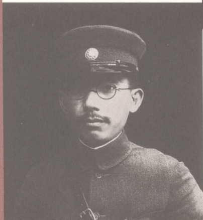
欲与蒋介石争高低的军阀唐生智