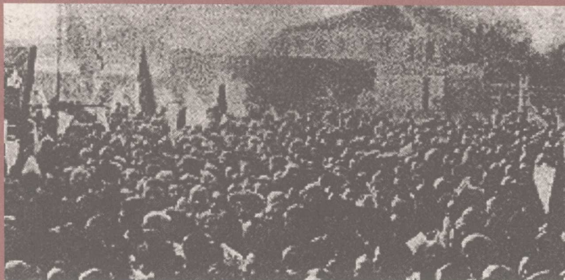
南昌市民欢迎蒋介石和北伐军