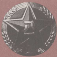
中国人民解放军军徽