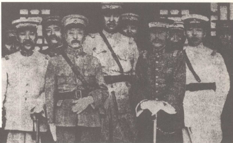
直系军阀吴佩孚（前右）、奉系军阀张作霖（前左）在北京会面