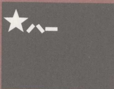
中国人民解放军军旗