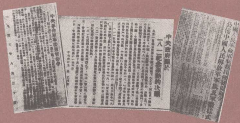
1949年6月15日，中央军委“以‘八一’为标志的军旗、军徽的命令”。