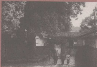
1933年，中华苏维埃政府在瑞金沙洲坝作出决议，8月1日为中国工农红军成立纪念日