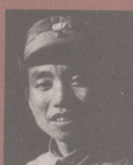
萧克 (1908- )