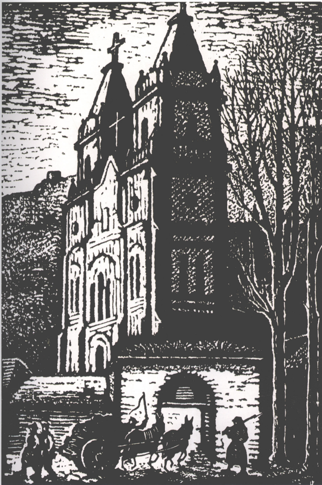
《昨日的教堂》(延安鲁艺校景) 1941年 / 力群

2001年12月25日是力群同志90华诞，又是他从艺70周年。作为力群同志的老战友，我谨以欢欣鼓舞的心情，向力群同志表示热烈的祝贺。