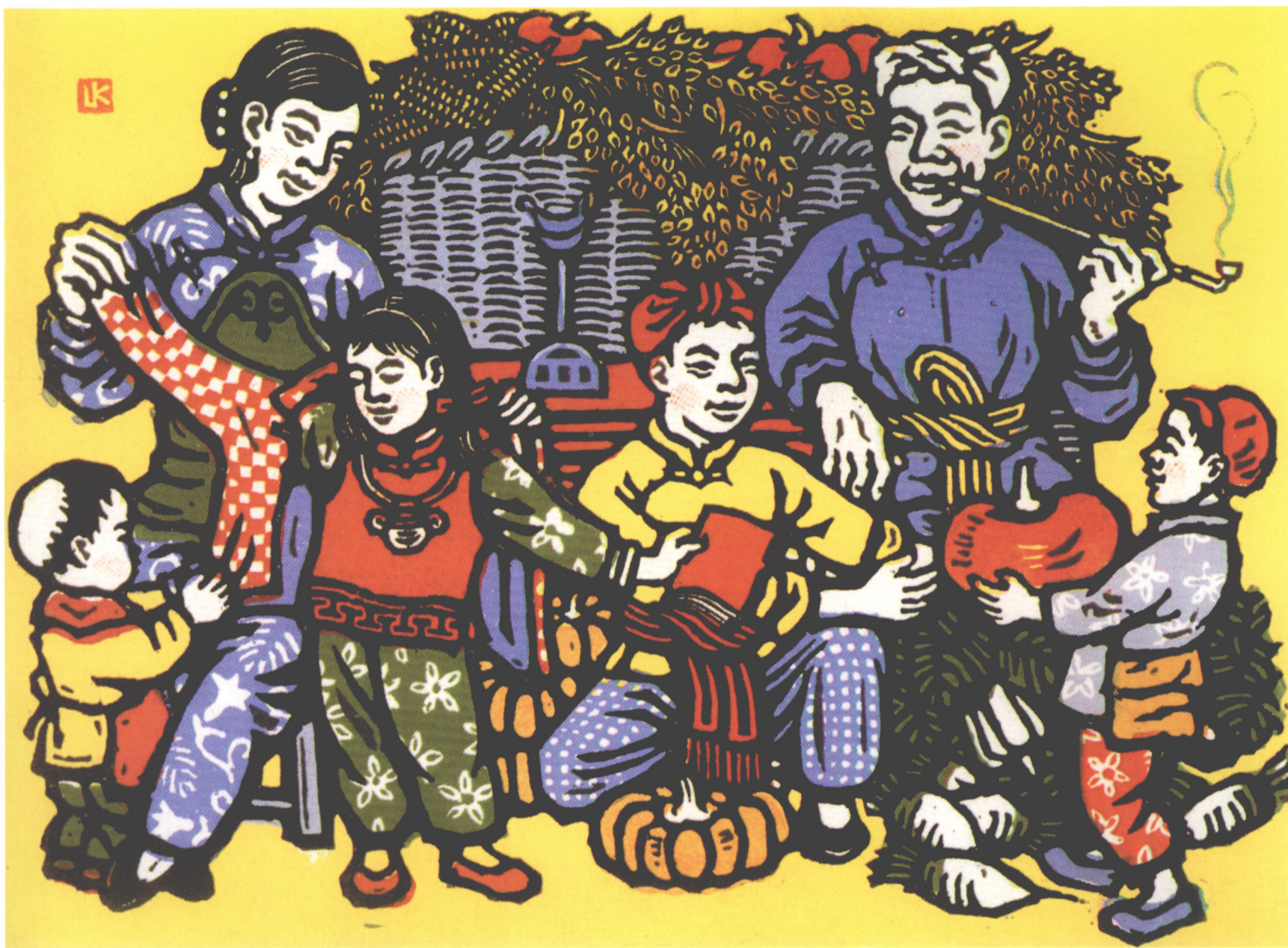
《丰衣足食图》 1944年/力群