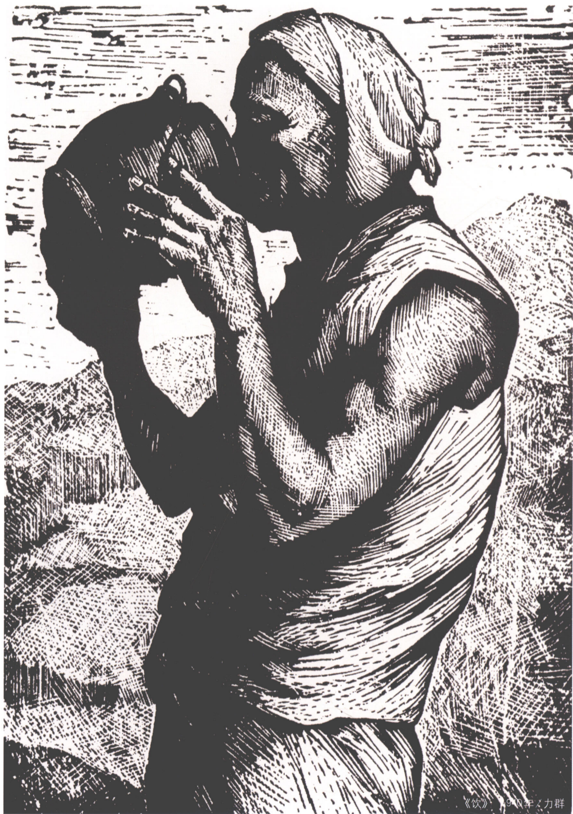
《饮》 1940年 力群