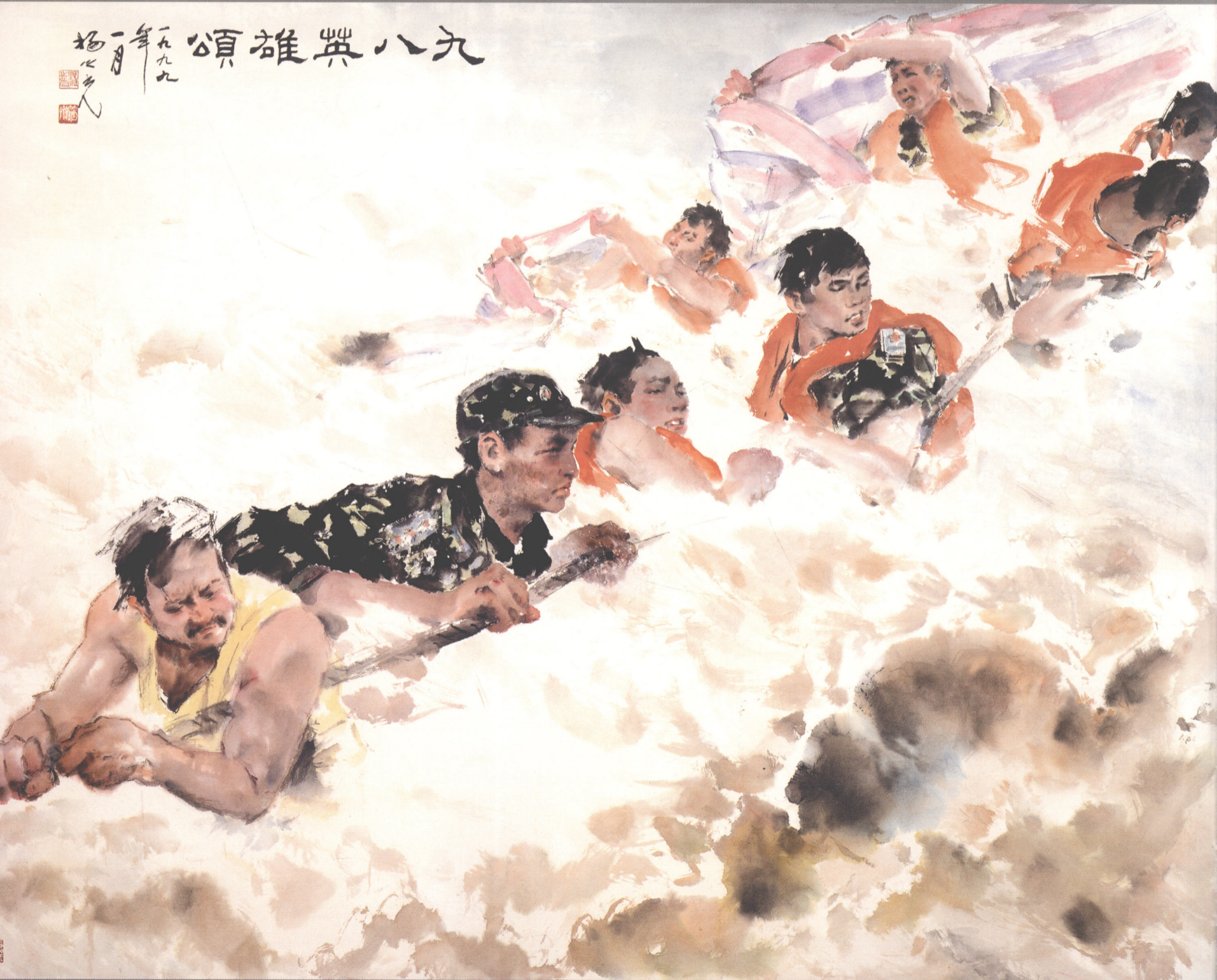
《九八英雄颂》(宣纸 水墨) 145cm × 210cm 1999年 / 杨之光

杨之光，1930年10月11日生于上海，广东揭西人。中学时期曾师从著名书法家李健学习书法、篆刻。师从著名诗人顾佛影（大漠诗人）学习诗词。1949年入广州市艺专及南中美院，从高剑父学习中国画。1950年入苏州美专上海分校中国画科学习，1950年夏考入北京中央美术学院绘画系，接受徐悲鸿、叶浅予、董希文等老师指导，1953年毕业。1953年至1958年任教于武昌中南美专，学校南迁广州后任教于广州美术学院中国画系，历任教授、系主任、美院副院长。现任广州美院教授、学院咨询委员会委员、岭南美术专修学院院长、中国画研究院院务委员、广东省国际文化交流中心名誉顾问、广东省文史馆名誉馆员、广东美术家协会顾问，1954年创作的《一辈子第一回》获“向科学文化进军奖”，巨幅作品《雪夜送饭》获1959年维也纳“第七届世界青年联欢节”金质奖章。1991年获美国纽约国际文化艺术中心颁发的“中国画杰出成就奖”，1993年获美国加州及旧金山市政府荣誉奖状。代表作有《浴日图》、《矿山新兵》、《石鲁像》、《九八英雄颂》等。著作有《中国画人物画法》、《杨之光画集》、《杨之光书法集》、《杨之光诗选》等。1997年至1998年间将用毕生心血创作的全部作品1200件捐赠给北京中国美术馆、广东美术馆、广州艺术博物院、广州美术学院。在广州艺术博物院内建立“杨之光艺术馆”专馆。2002年9月“杨之光艺术中心”在广州市番禺区落成。2006年12月作品《矿山新兵》《激扬文字》（1973年鸥洋合作）被评为广东美协成立50周年经典作品，2007年入选广东省50名文化名人。