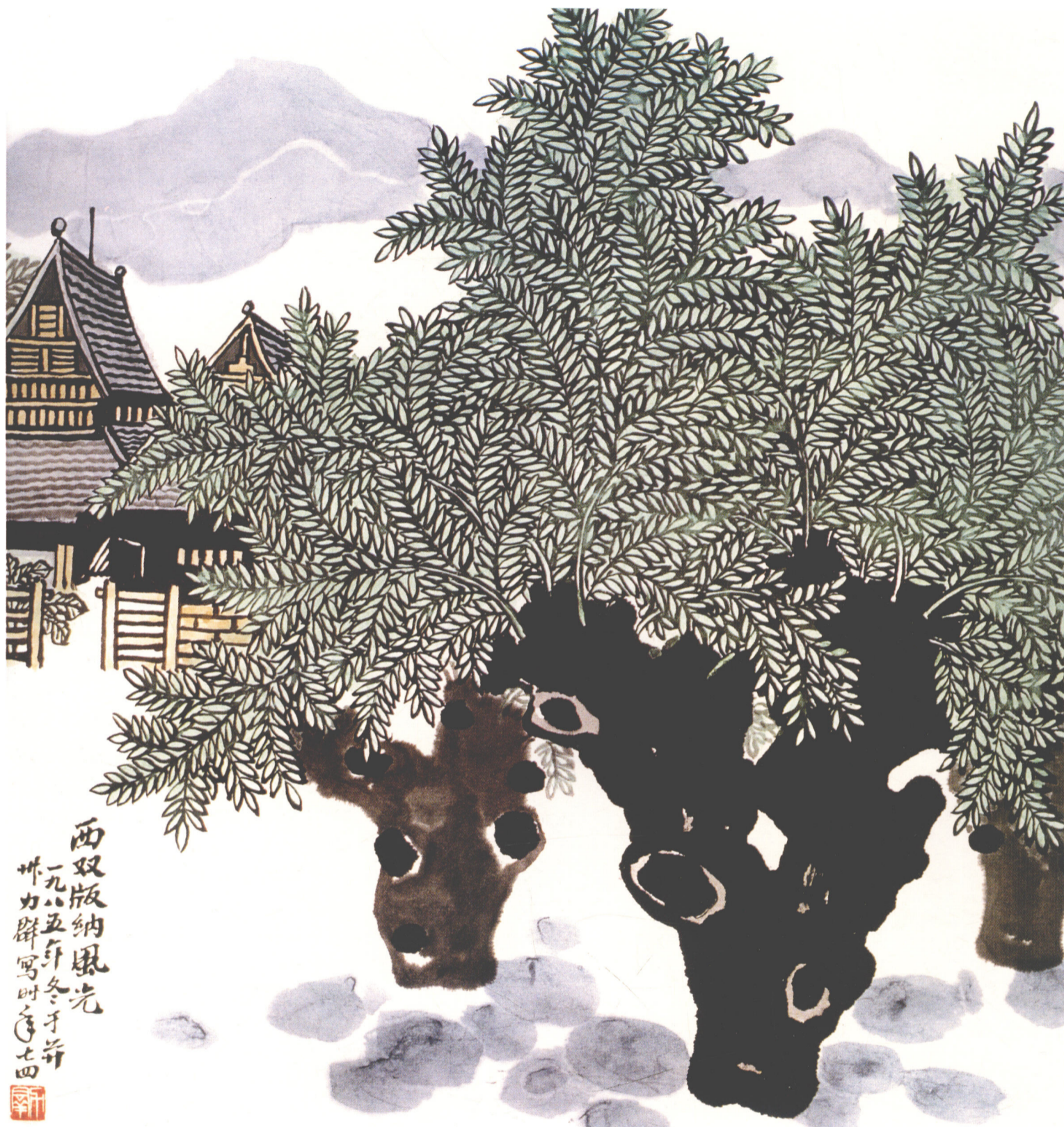
《西双版纳风光》(中国画) 63.5cm × 61cm 1985年 / 力群