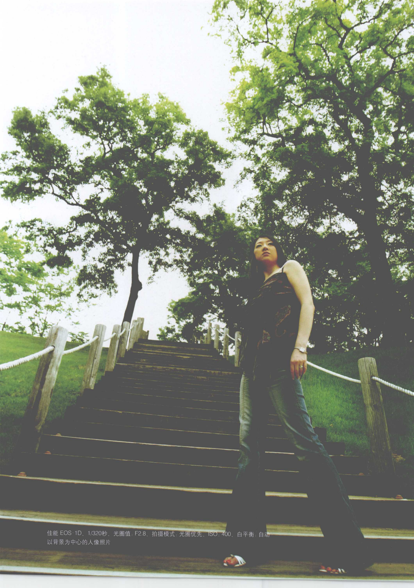
佳能 EOS-1D、1/320秒、光圈值：F2.8、拍摄模式：光圈优先、ISO：400、白平衡：自动 以背景为中心的人像照片