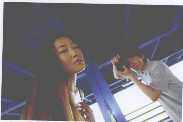
佳能 EOS-1D、1/25秒、光圈值：F2.8、拍摄模式：光圈优先、ISO：100、白平衡：自动 女性人物的个人档案照片拍摄场面