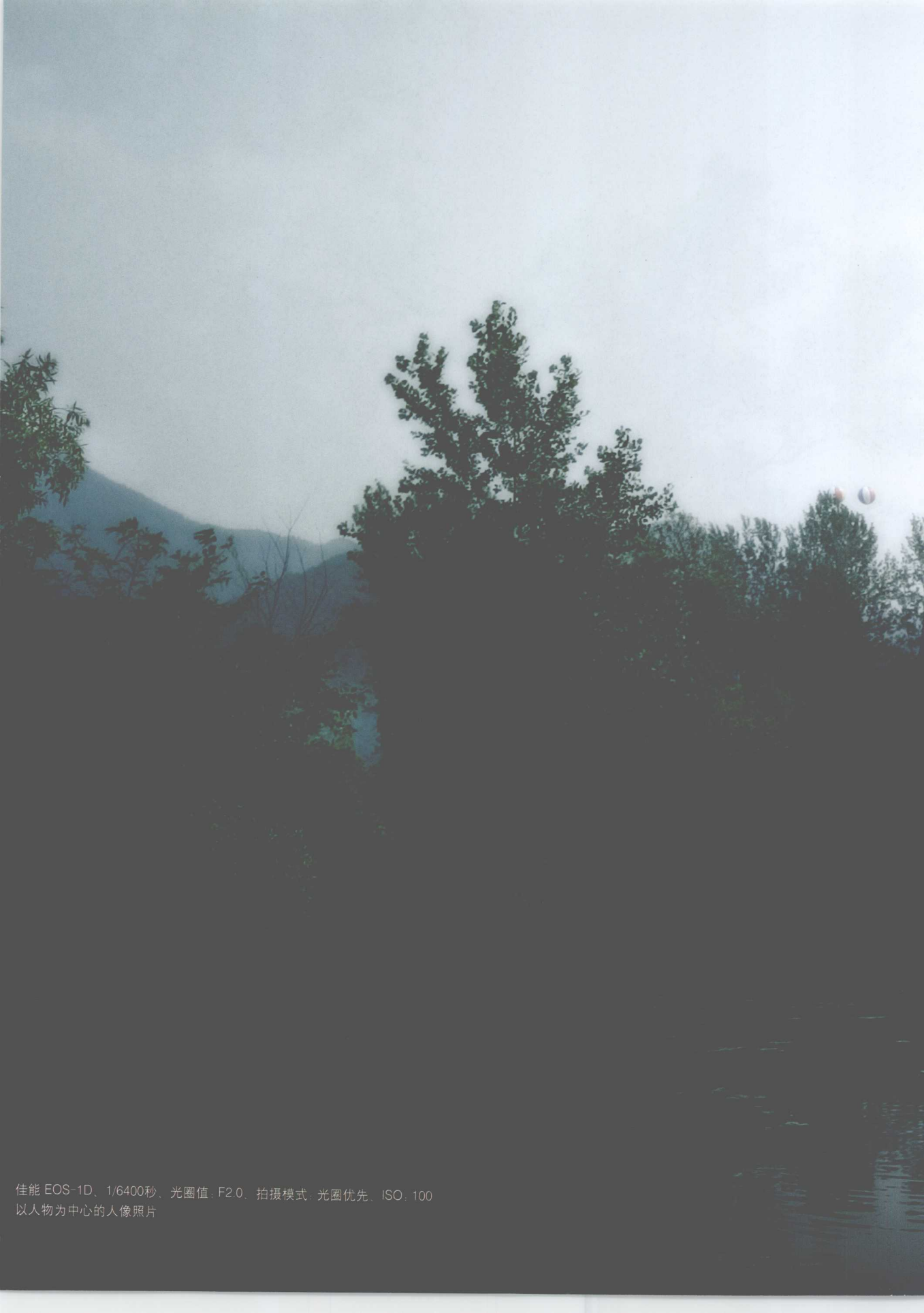
佳能 EOS-1D、1/6400秒、光圈值：F2.0、拍摄模式：光圈优先、ISO：100 以人物为中心的人像照片