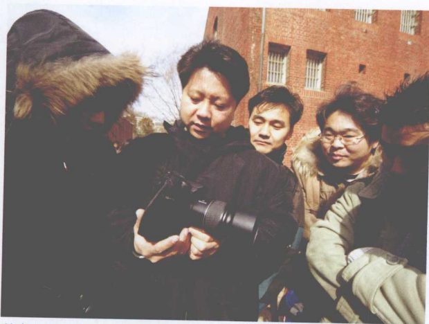
笔者在用LCD确认已拍摄的图像，同时也在说明拍摄技巧

偶尔在电视中看到当红艺人的MV或广告拍摄现场的相关画面时，笔者都会停下手头的事情，仔细观看电视节目。其中，最关注的是怎样安排模特、与人物的交流如何进行等方面；其次，再关注拍摄设备以及周围的工作人员。在关注这些情况的同时，笔者会不知不觉融入其中，感受兴奋与心跳，仿佛置身其中。