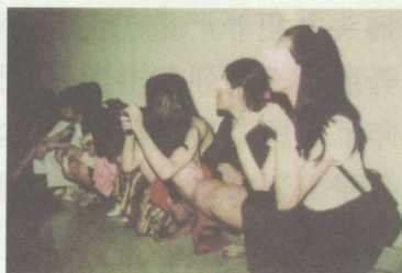
吸毒女青年多有卖淫行为

已经构成社会经济协调发展的严重阻碍。吸毒人员普遍丧失了劳动能力，无法再为社会创造新的财富。吸毒吞噬了大量社会财富，全国仅海洛因滥用者每年吸毒的花费就不低于200亿元人民币，