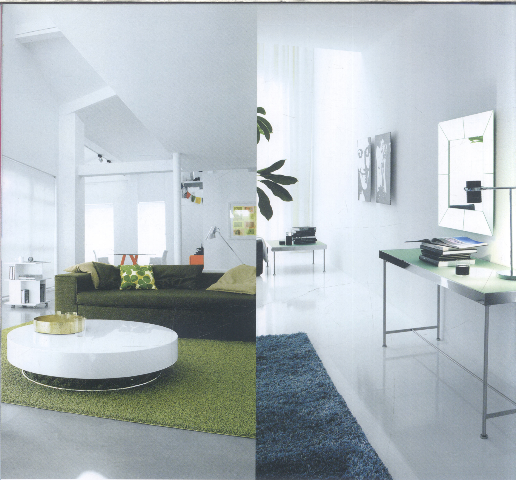
Inner room is spacious and transparent amid the brightness of mirror and glass. 透是扩展室内空间的诀窍，镜子和玻璃的应用是关键所在。