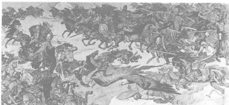
成吉思汗统一漠北图。