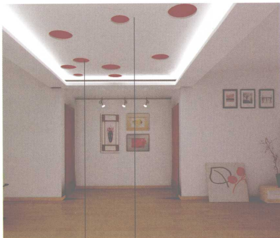
彩色乳胶漆 | 石膏板造型

★一般将这种方法用在卫生间、厨房、阳台和玄关等空间，既起到相应的功用，又不必大费苦功。