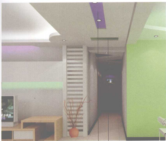
彩色乳胶漆 | 磨砂玻璃