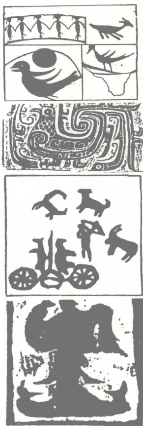
从原始社会的彩陶、岩画，商周青铜器以及汉画像石艺术中，都可以寻觅到以影像作为形象表现的艺术手法。

在造纸术发明之前，人们便开始在树叶、丝绢、金银箔等薄质材料上采用镂刻、透空的艺术语言制作“类剪纸”了。这种“类剪纸”，迄今在全国不少地区的出土文物中都有发现，按出土文物的制作年代排列，最早的应是湖南的近邻——湖北江陵望山楚墓中出土的镂空刻花皮革，在加工得很薄的皮料上，用镂空刻花的方法刻出细密的几何形连续花纹，显得剔透精巧，是当时皮革雕镂工艺的佳作。其次，要算长沙五里牌西汉墓出土的漆奩上的金箔饰片 ① ，工匠塑造的细小动物影像，外形准确而生动，体现出娴熟的走刀