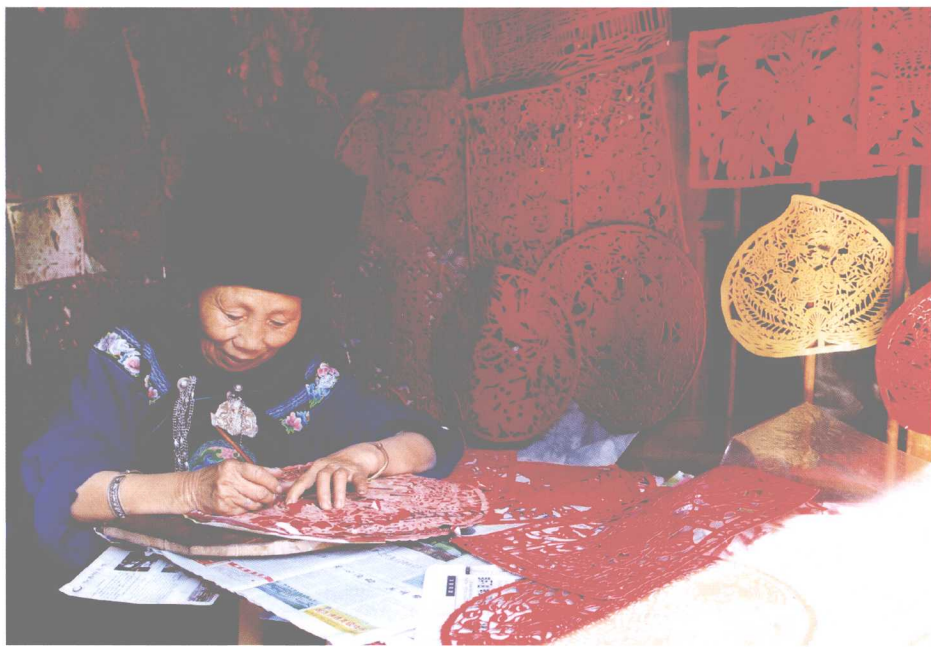
流行于湘西少数民族地区的凿花，是一项饶有特色的民族民间工艺。