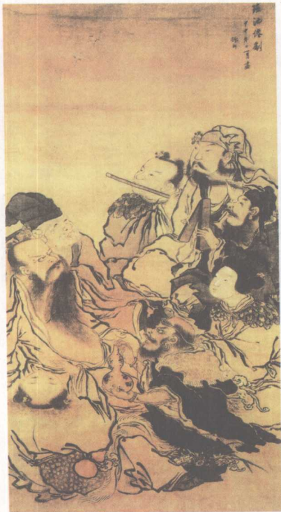
▲描绘了古代传说中八仙的《瑶池仙聚图》(清代张羽中所作,立轴绢本设色)