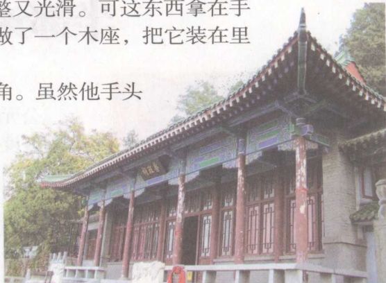
▲千佛山历山院内的鲁班祠