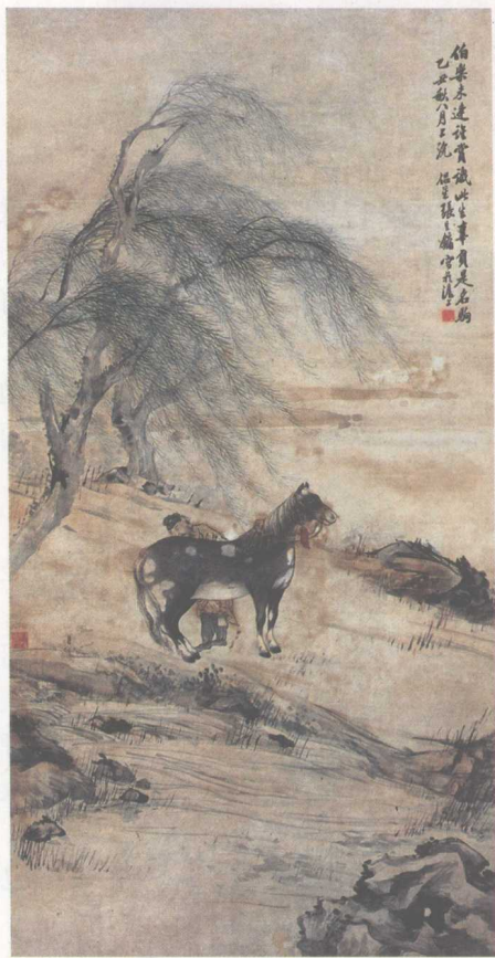
画家张生铺笔下的《伯乐相马图》

伯乐一见儿子手中的癞蛤蟆，连连摇头，想不到儿子竟是如此愚笨，真是让人哭笑不得，转而打趣道：“就是这‘马’太爱跳了，没办法骑呀！”接着感叹道：“所谓按图索骥也。”