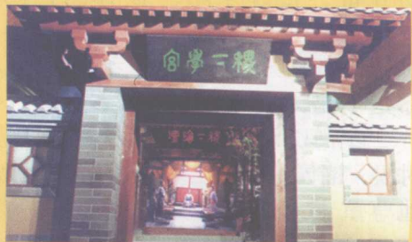
▲中国最早的官办高等学府——稷下学宫

“稷下学宫”集中了儒、墨、道、法、兵、刑、阴阳、农、杂各家学派的学人，著书立说，开展学术研究，形成了前所未有的百家争鸣，创造了我国灿烂的先秦文化。