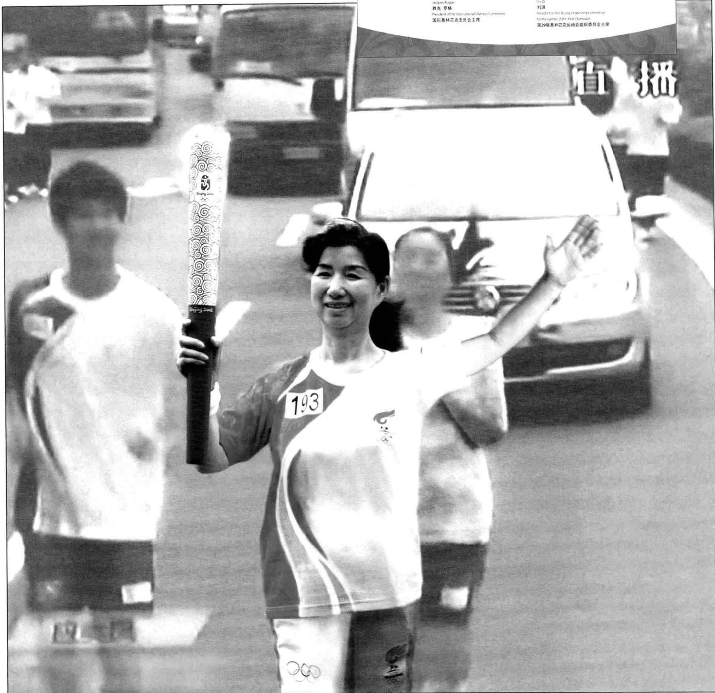
2008年5月23日下午2时应美凤在上海世纪公园路段传递奥运火炬

刘淇 President of the Beijing Organizing Committee for the Games of the XXXI Olympiad 第29届奥林匹克运动会组织委员会主席