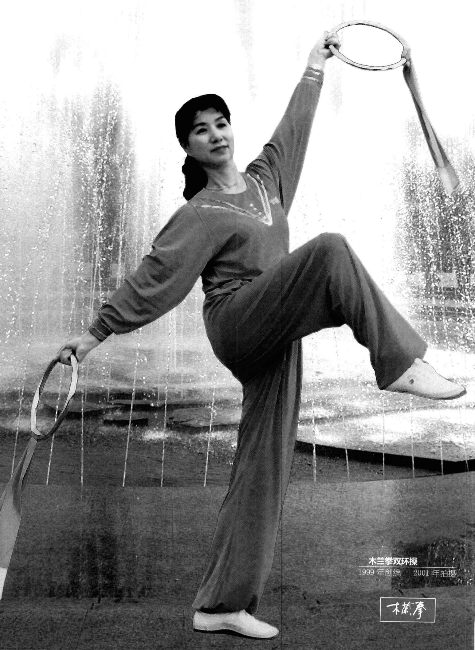
木兰拳双环操 1999年创编 2001年拍摄