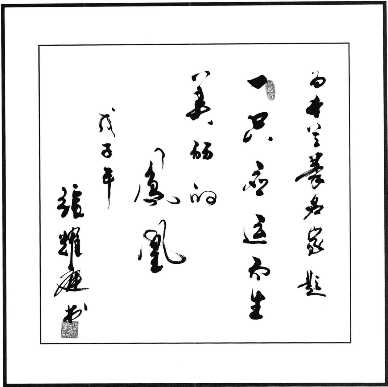
原中国武术协会主席、中国武术院院长张耀庭题词