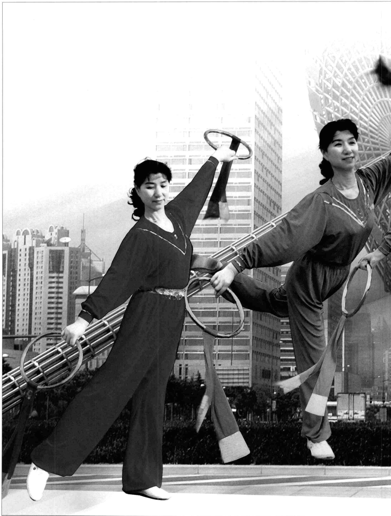
木兰拳双环操 1999年创编