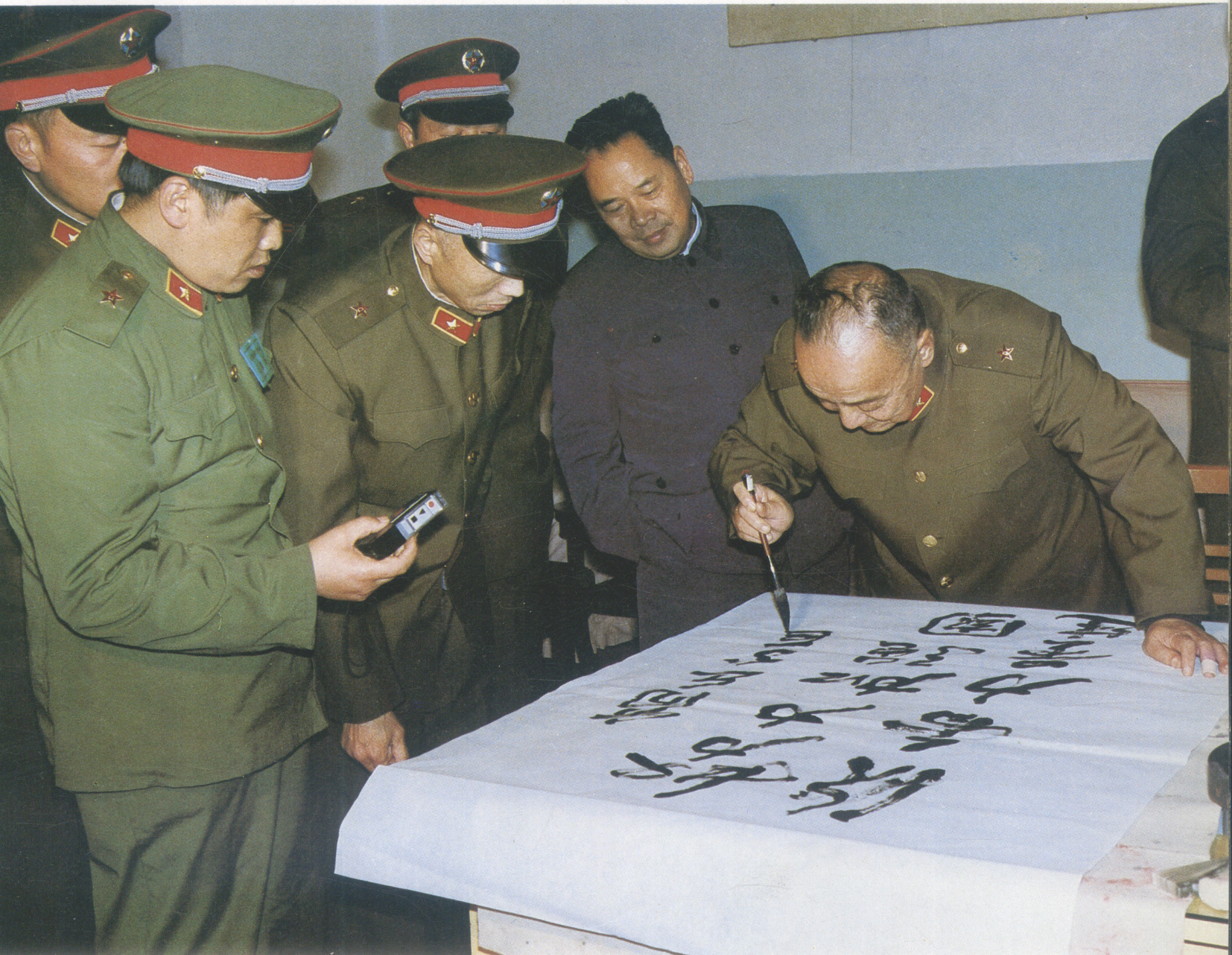
中央军委副主席杨尚昆为民兵题词