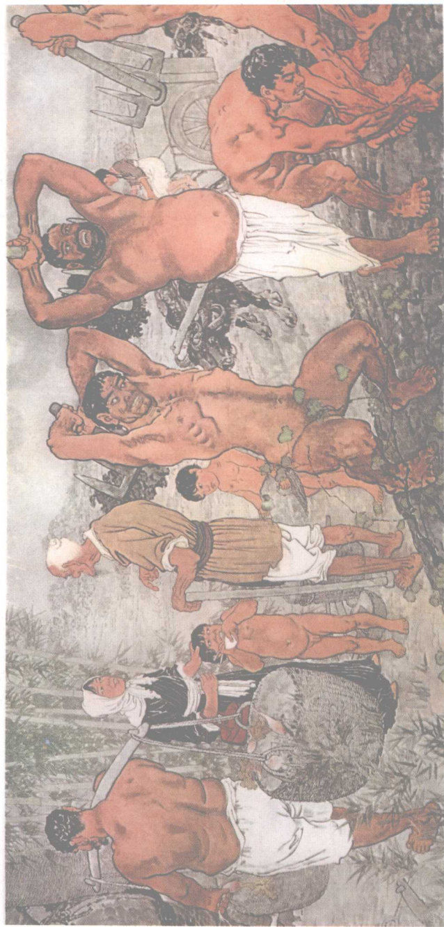
愚公移山（国画1940年）局部 徐悲鸿