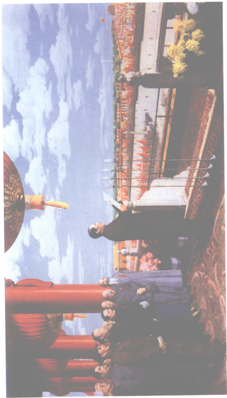
开国大典（油画1952年） 董希文