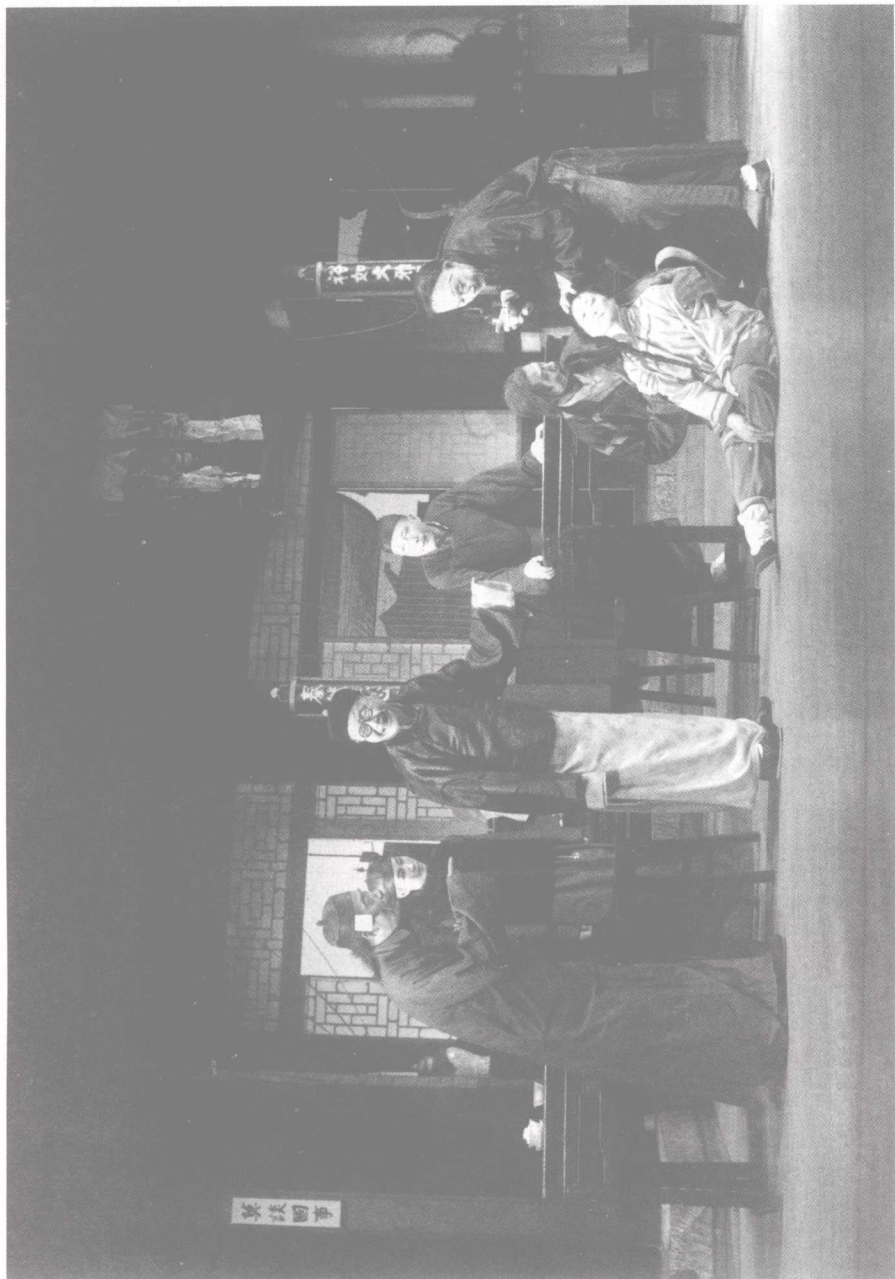
茶館（剧照） 北京人民艺术剧院