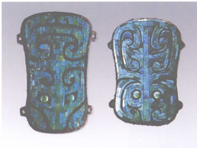
彩图4-7 镶嵌绿松石兽面纹青铜牌 二里头文化 左.长16.5厘米 右.长14.2厘米 河南偃师二里头出土 (正文第160-161、333页)