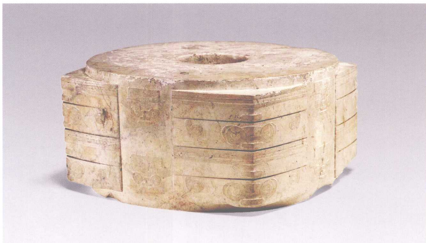
彩图 3 - 145 神人兽面图案玉琮 良渚文化 高 8.9 厘米 浙江余杭反山出土 (正文第 129 - 130 页)