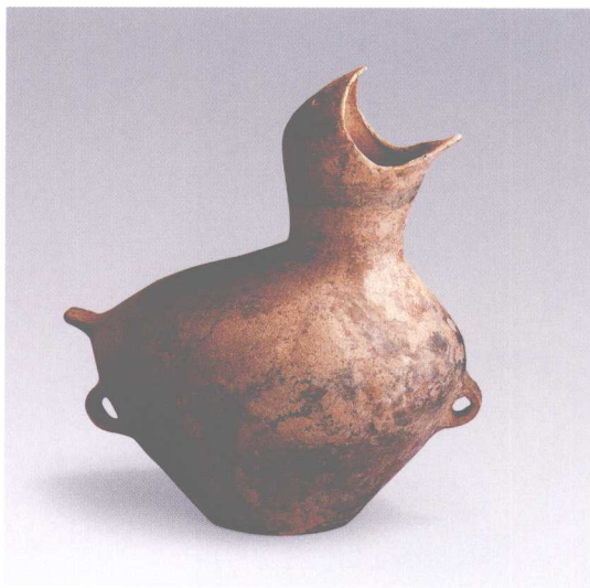
彩图3-154 鸚形彩陶壺 小河沿文化 高37.2厘米 內蒙古赤峰大南沟出土 (正文第133-134页)