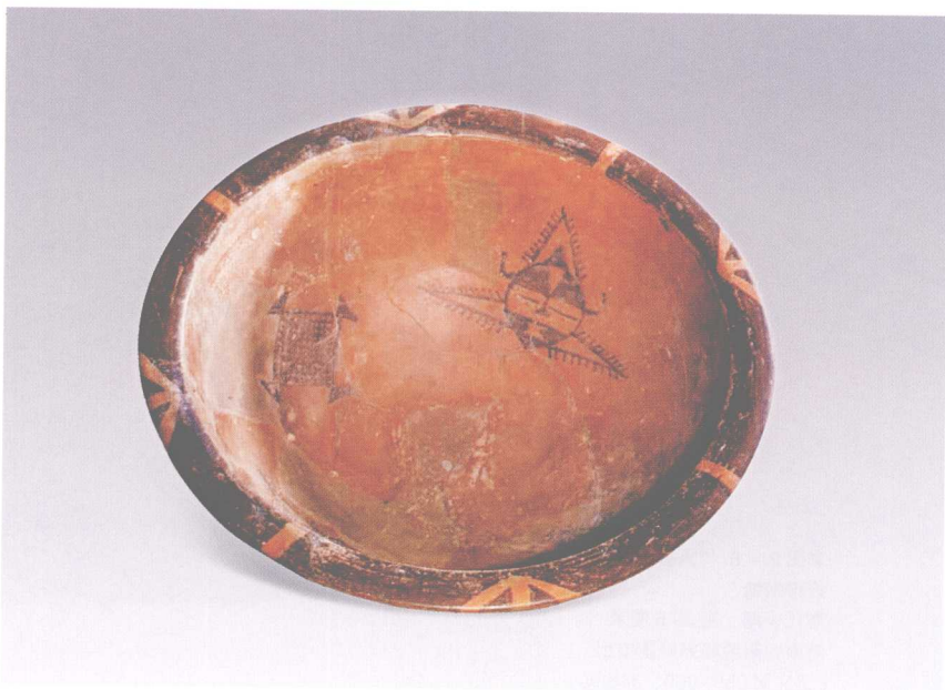
彩图3-8 人面纹网纹彩陶盆 仰韶文化 口径39.5厘米，高16.5厘米 陕西西安半坡出土 (正文第080页)