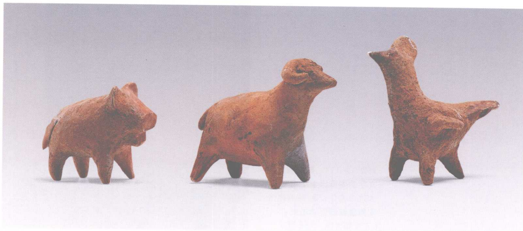
彩图 3 - 93 陶塑动物 石家河文化 高 6 - 9 厘米 湖北天门邓家湾出土 (正文第 109、111 页)