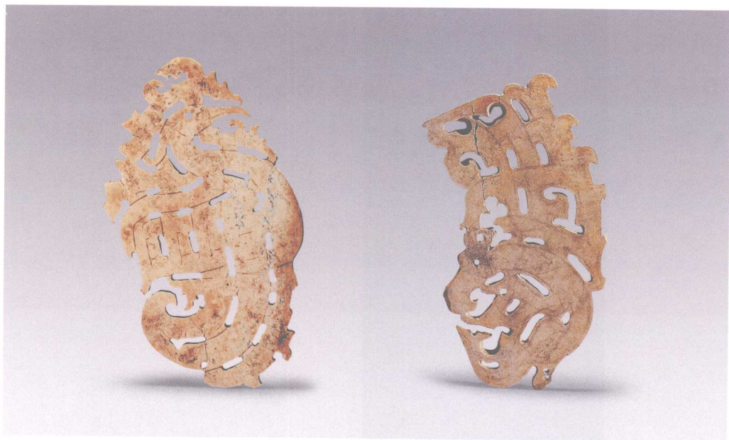
彩图 3 - 85 玉凤与玉龙 湖南龙山文化 凤.高 12.6 厘米 龙.高 9.1 厘米 湖南澧县孙家岗出土 (正文第 109 - 110 页)