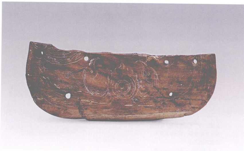
彩图3-31 双鸟朝阳纹象牙器 河姆渡文化 长16.6厘米 浙江余姚河姆渡出土 (正文第088页)