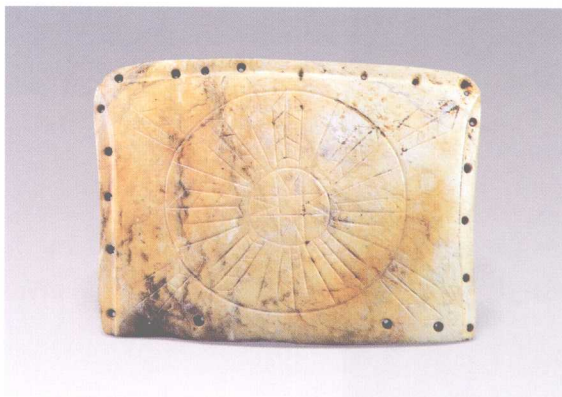
彩图 3 - 148 玉龟与玉版 凌家滩文化 龟长 9.4 厘米，玉版长 11 厘米 安徽含山凌家滩出土 (正文第 131 页)