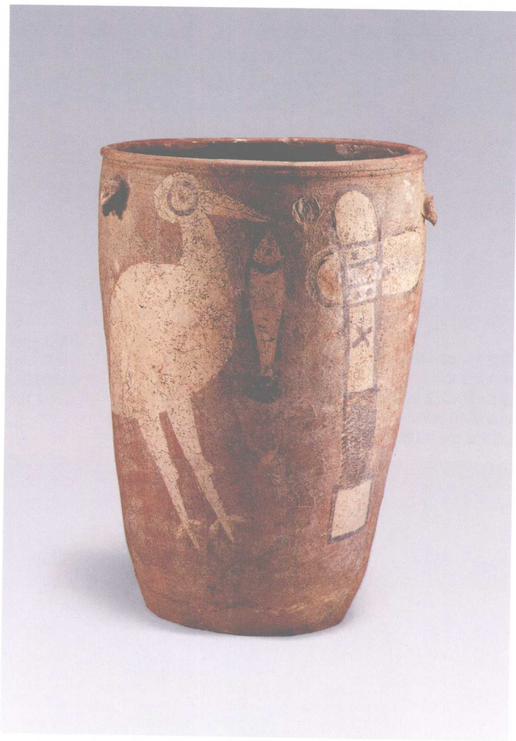
彩图 3 - 23 鸛鱼石斧图陶缸 (瓮棺) 仰韶文化 高 47 厘米 河南临汝阎村出土 (正文第 082 - 083 页)