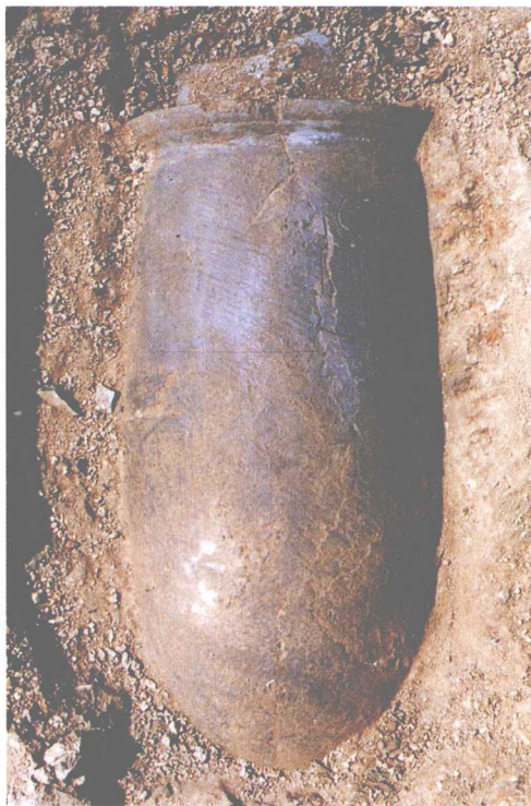
彩图3-111 刻划有图形 文字的陶尊出土现场 大汶口文化 高59.5厘米 安徽蒙城尉迟寺出土 (正文第115、118页)